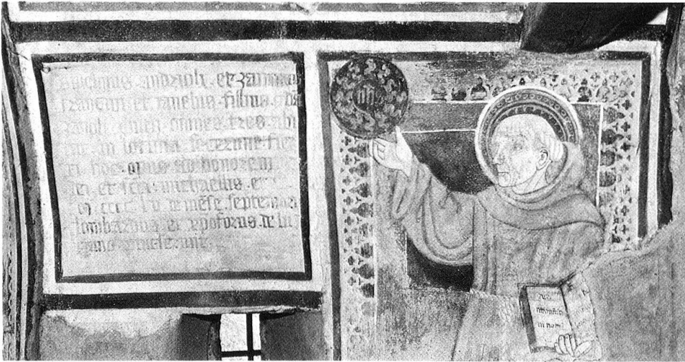
5 Lottigna. Cappella (1455).

ziario. Nello stesso ordine di idee possiamo situare un altro significativo episodio che completa e giustifica il termine di strategia utilizzato poch'anzi, rivelandoci lo stesso felice connubio di devozione e autoaffermazione sociale che caratterizza le committenze di questo ceto dirigente. Trent'anni più tardi – l'anno del celebre scontro tra gli Svizzeri e le milizie ducali – vediamo infatti operare il nipote del Bichignoli, lui pure notaio, e il nipote di Cristoforo da Seregno, quindi la stessa famiglia di committenti – qui forse affiancata dalla collettività – e la stessa bottega d'artisti , nel coro della chiesa di San Nicolao, sempre a Giornico, per l'esecuzione di un vasto ciclo di affreschi. Due iscrizioni certificano questa collaborazione: «Mccccclxxvij/die ultimo mensis/maii(?) hoc opus/finitus fuit nicola[...]/seregnio de luglano/pinsit» e sotto «Mccccclxxvij/[t]ales fuerunt actores/Ser Magnus de iudicibus/et [p]etrus bichignio[li]/notarius huius ecclesie et bonorum/procuratores» 25 . Specularmente e seppur circoscritti tra le minuzie locali, i due episodi ci offrono così un prezioso spiraglio per valutare la fisionomia, non solo culturale, di questi gruppi committenti e valutare, sullo sfondo di una produzione artistica sufficientemente ampia e probante, le loro inclinazioni, le loro attese e lo spessore della loro presenza sociale, anche al di là di quanto avrebbe potuto suggerire lo statuto di notaio 26 .