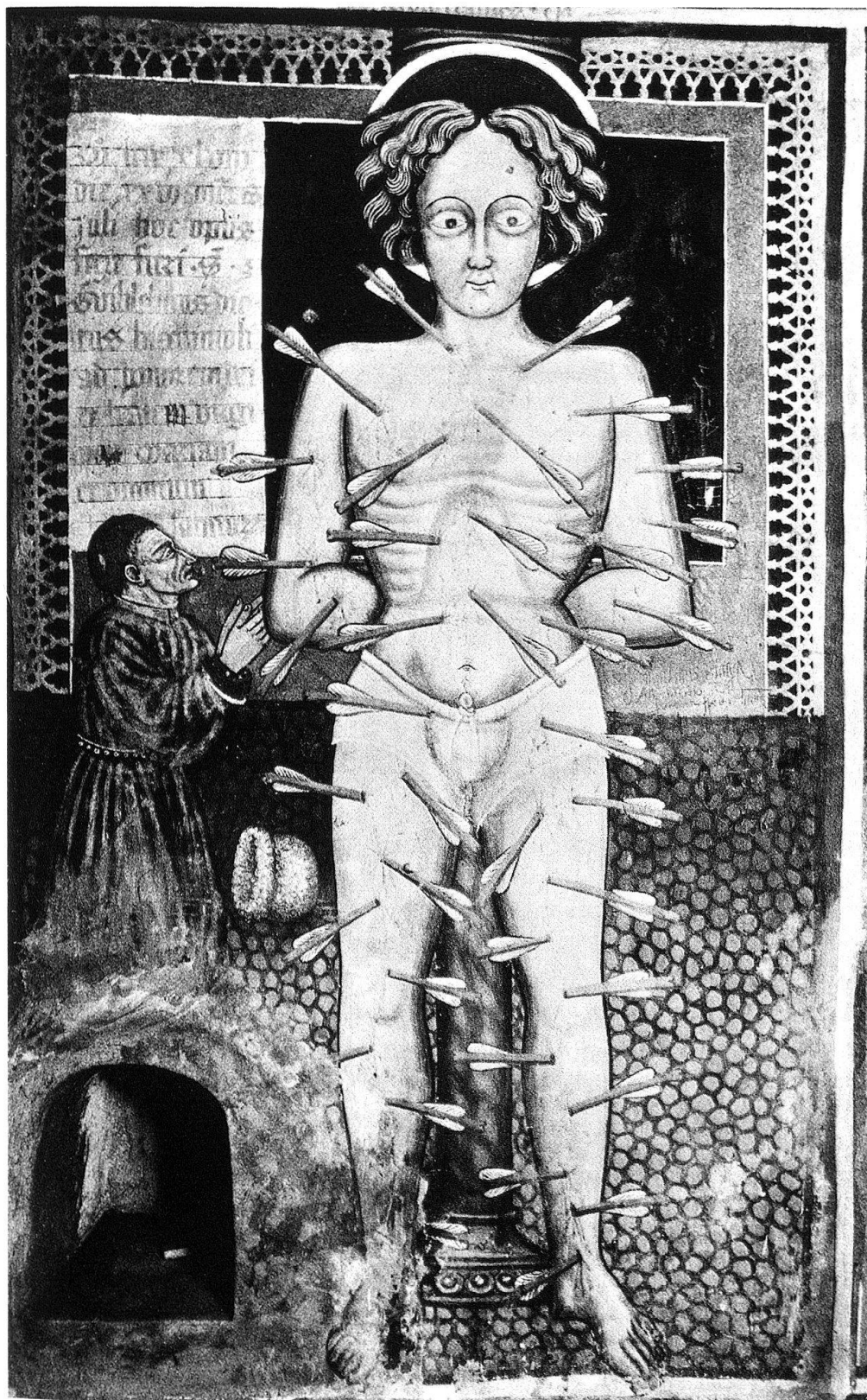
1 Giornico. Chiesa di Santa Maria del Castello (1448).

seguito e subisce un ampliamento a settentrione, con l'aggiunta di una seconda navata ad abside quadrangolare. Nel frattempo, i legami con i da Giornico ci sfuggono, come del resto ogni indicazione chiaramente interpretabile sulla costruzione e sui suoi utenti. Di certo possiamo supporre una funzione attiva del castello nel panorama locale, tale da giustificare la sua distruzione da parte degli Sviz-