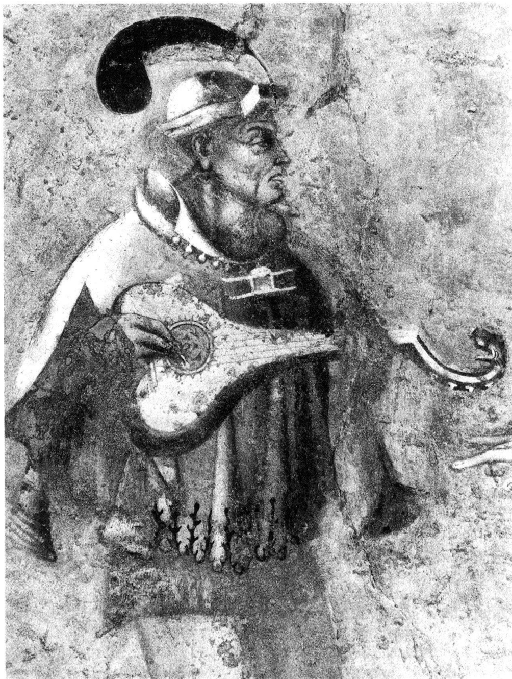
7 Campione, Santa Maria dei Ghirli. Il musicista gozzuto.

bianca a fiorellini. Purtroppo la Crocefissione ha sofferto parecchio l'umidità, ma i pochi particolari che ancora traspasano sono di grande delicatezza, da richiamare alla mente le Crocefissioni di Crevenna e quella già a Monzoro (ora ai Musei Civici del Castello Sforzesco di Milano) 20 . Al di sotto si snoda una incantevole serie dei Mesi, eseguiti a monocromo con grande cura dei dettagli e notevole effetto plastico. Le aggraziate e ben tornite figure ricordano da vicino i fogli dei « Tacuinā sanitatis » e non sfigurerebbero al paragone con i più raffinati disegni su carta del periodo, per le loro delicate lumeggiature bianche e l'armonioso inserirsi nello spazio. In particolare, la figura dell'Aprile 21 riprende con sorprendente puntualità il personaggio maschile del « Liebesgarten » integrato nel Giudizio Universale di Campione 22 . È questo un caso molto tipico e interessante in cui si può verificare la circolazione di un tema iconografico anche a vasto