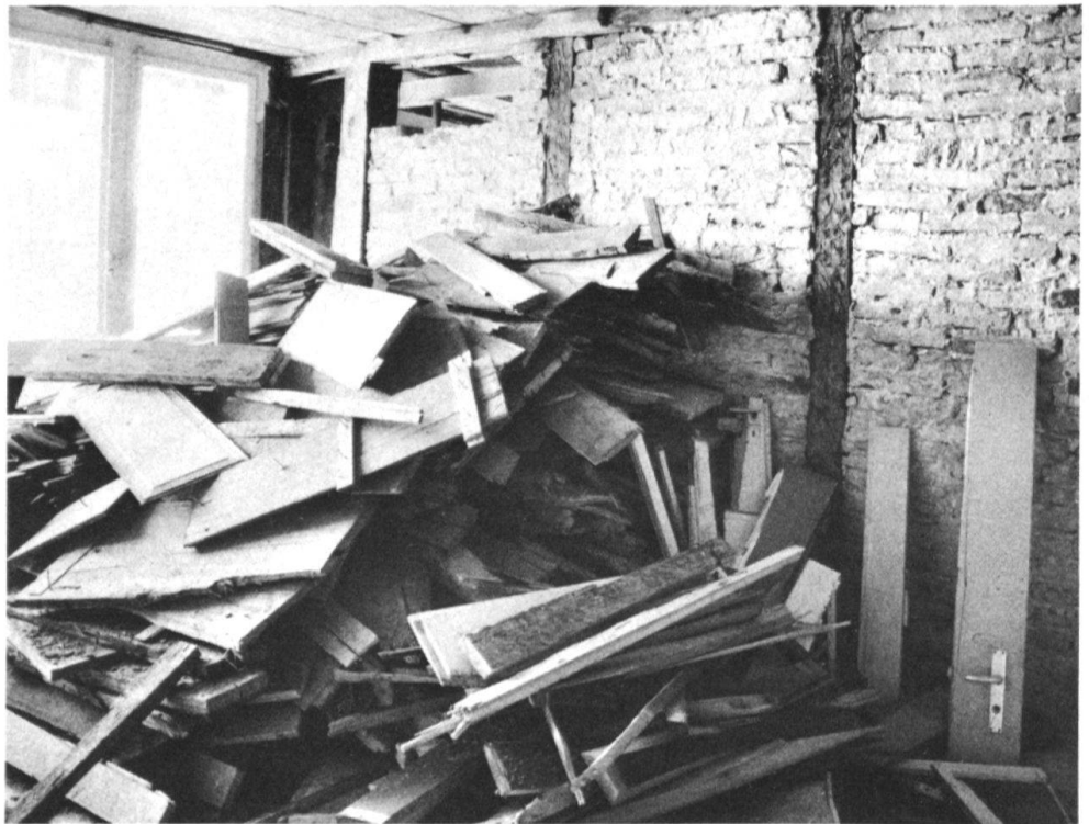
3 Herausgerissene Täfer in einem Wohnraum an der Rathausgasse.

von universeller Bedeutung zu sein, die Motivation verbessern, zum eigenen Haus Sorge zu tragen. Auch die öffentliche Meinung kann im Verlauf der Zeit das Tun und Lassen der Privaten beeinflussen.