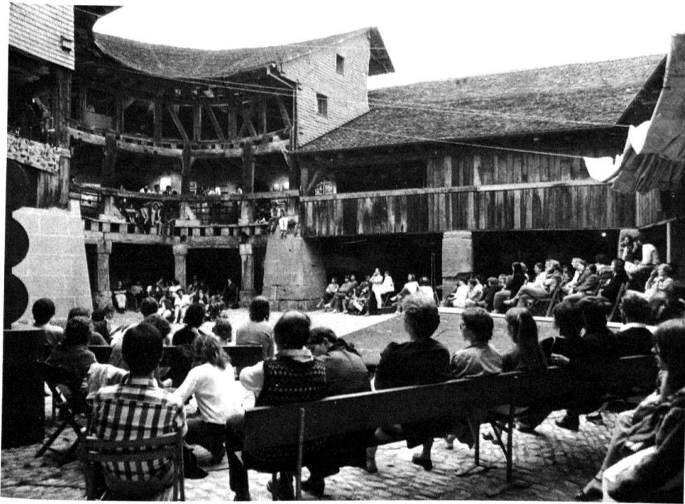
3 Cet ancien bastion tardif de l'enceinte, autrefois utilisé comme dépôt, a simplement été dégagé. Le Belluard (Bollwerk) a retrouvé un bon usage grâce à une intervention minimale.

Cet effort louable ne devrait pas rester isolé: il devrait s'accompagner d'une mise en valeur d'espaces publics libérés des voitures et d'une promotion de la restauration privée, favorisant les méthodes artisanales, encourageant les méthodes de restauration douces permettant de conserver dans les quartiers populaires de la Vieille Ville des logements à prix modérés. Ne serait-ce pas là le rôle de la Conservation des Monuments d'en fournir les bases scientifiques?