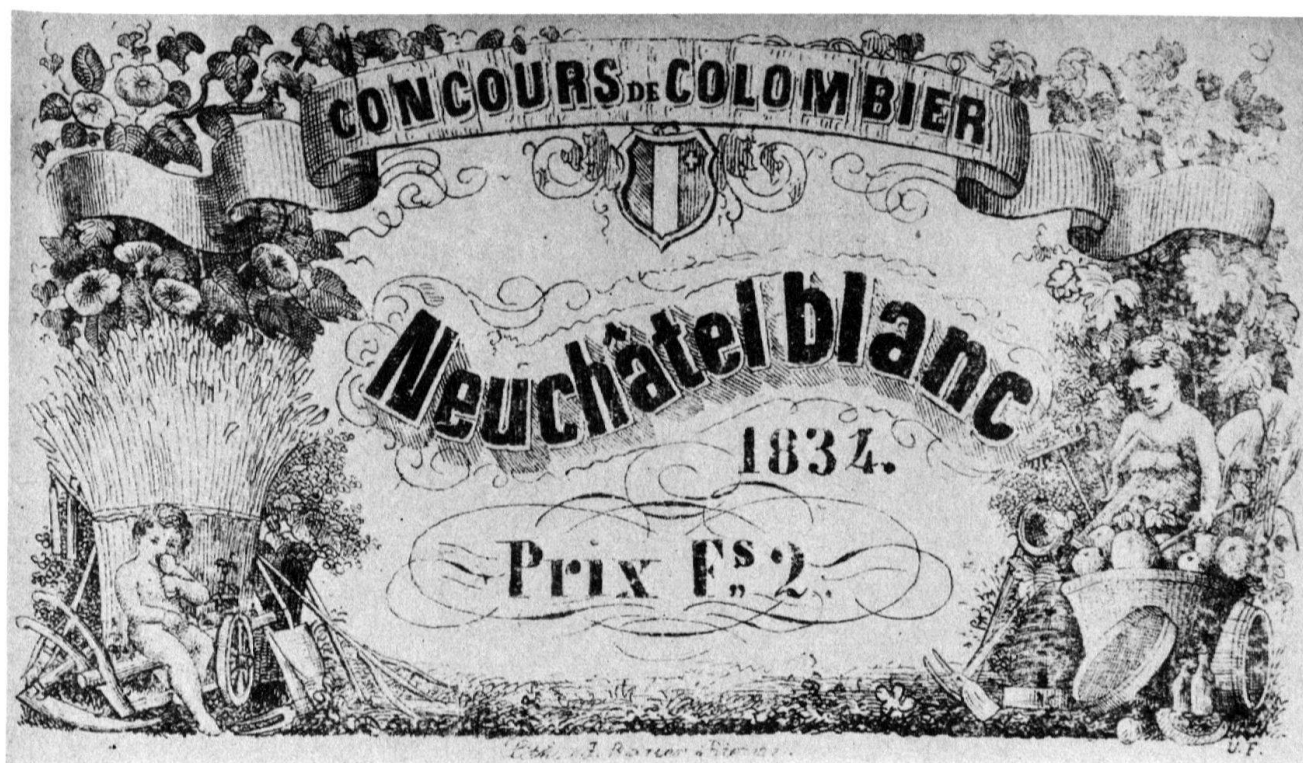
3 Etiquette de 1834, verte. Coll. Musée de la vigne et du vin, Boudry.

lement à la pratique de la médecine, les Otz avaient acquis à Cortaillod un important domaine viticole dont ils commercialisèrent les produits. C'est l'étiquette qu'ils employèrent à cet effet que nous allons présenter.