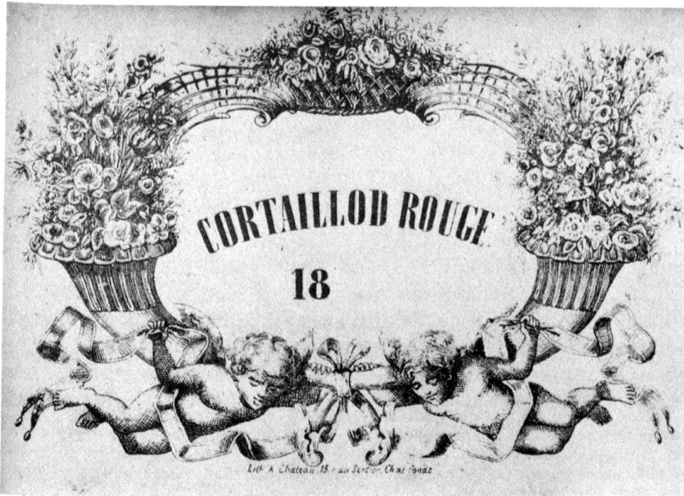
4 Etiquette neuchâteloise typique du XIX e , coll. Musée de la vigne et du vin, Boudry.

tiers, est tombé en défaveur depuis l'introduction du colza, à raison de l'huile que fournit ce dernier, et avec laquelle on remplace celle de noix.» 15