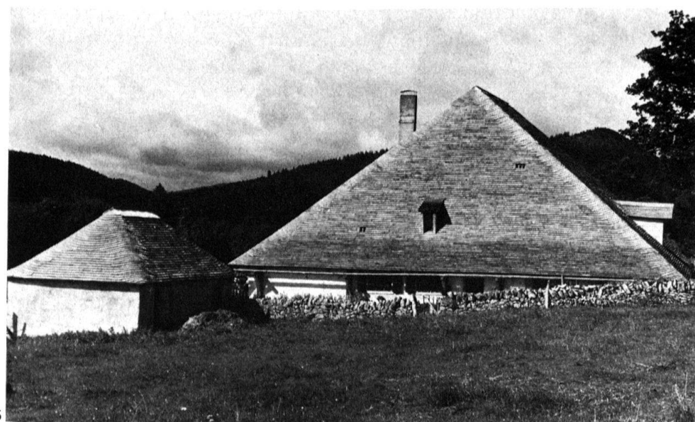
4 Commune de Gingins. La Barillette. Le «laitier» à l'angle nord-est de la construction est recon- naissable à sa double rangée de «larmiers».