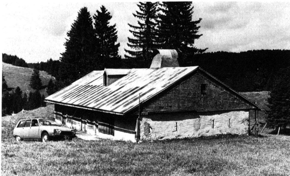
8 Commune du Chenit. Chalet de la Petite Mey- lande. Alpage du «pre- mier étage d'estivage» à la Vallée de Joux, pro- priété privée.