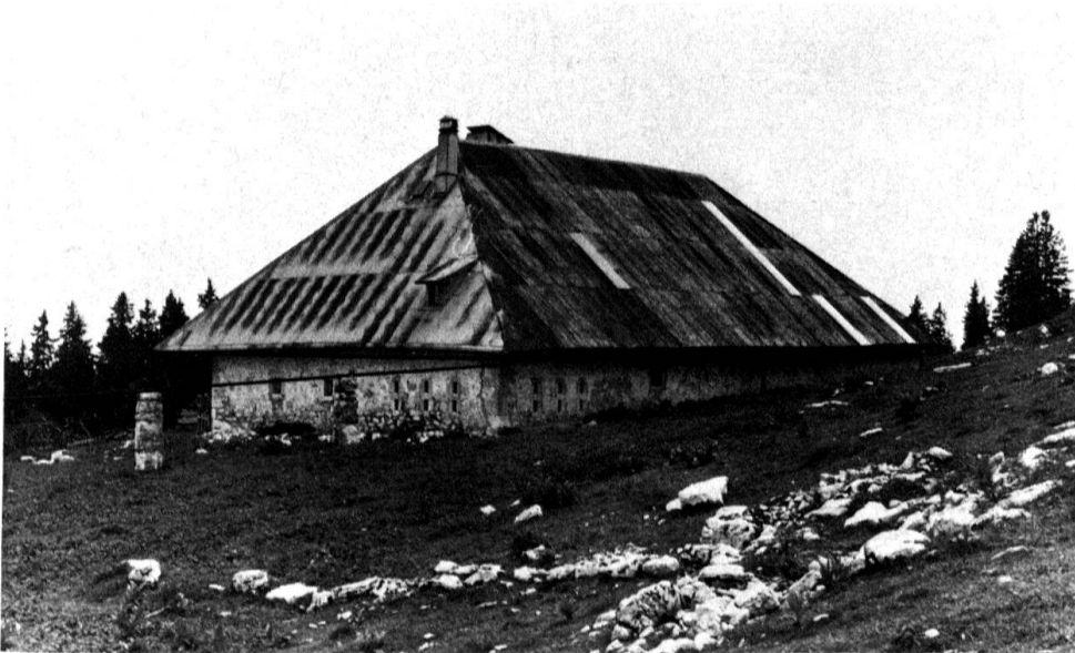
4 Commune de Gingins. La Barillette. Le «laitier» à l'angle nord-est de la construction est recon- naissable à sa double rangée de «larmiers».