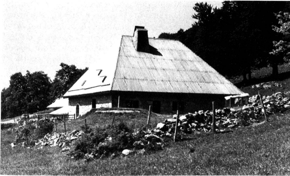
3 Commune de La Praz. Chalet Lyon.