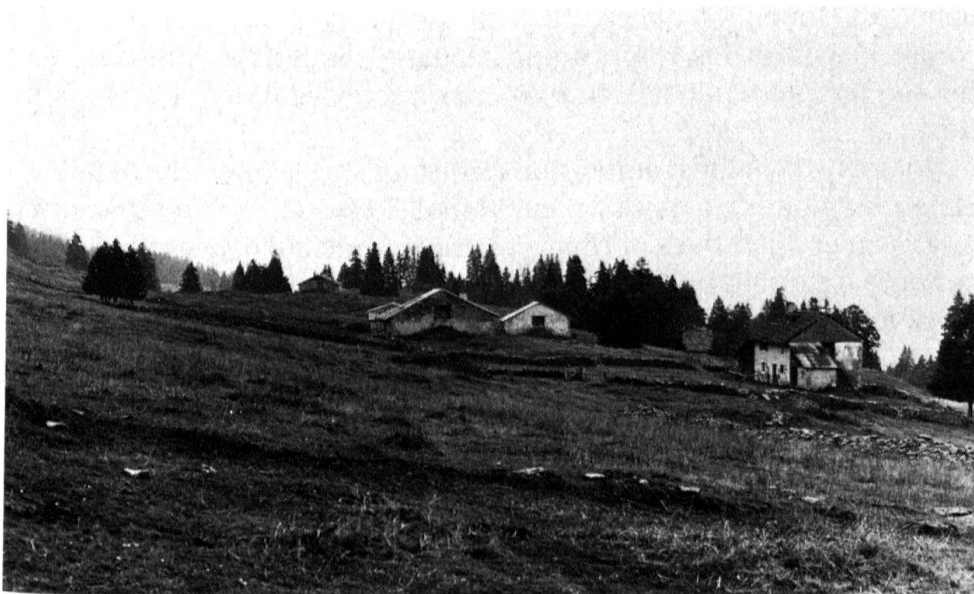
9 Commune d'Arzier. Alpages du village fran- çais de Bois d'Amont, au lieu-dit «Sur la Côte».