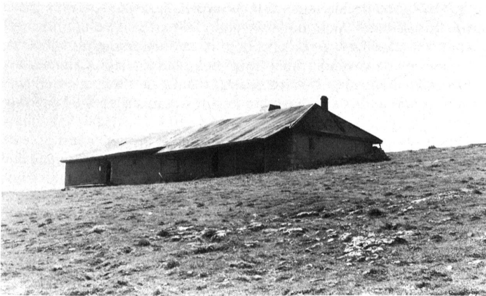
7 Commune de Bérolette. Chalet de Druchaux du type plan rectangulaire allongé étroit.