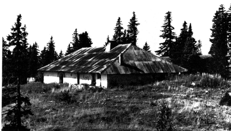
2 Commune de Bière. Chalet du Mont-de-Bière Devant.

Les couches de l'«écurie» sont constituées par des planches posées à même le sol; les bêtes sont placées en rangs, le plus souvent deux groupes de deux rangs opposés et séparés par une rigole permettant l'évacuation du lisier. De l'«écurie», on entre directement dans la fromagerie appelée cuisine, grâce à une ou deux portes percées dans le mur de séparation; cela évite aux bergers des déplacements inutiles lorsqu'ils apportent le lait de la traite. La cuisine est le local central