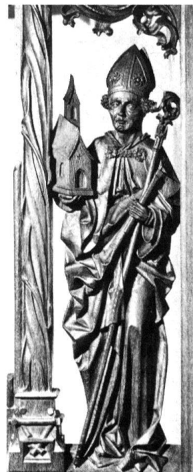
8 Ulrich Rosenstain. Hl. Wolfgang, 1486. Chorgestühl von St. Wolfgang, Hünenberg; heute Schweiz. Landesmuseum, Zürich.