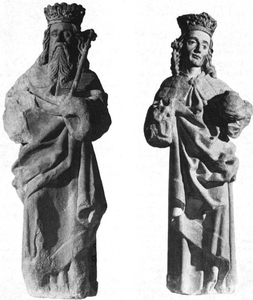
1 und 2 Ulrich Rosenstain. Hl. Jodok und hl. Heinrich, 1479–1483. St. Oswald, Zug; heute Museum in der Burg Zug (Leihgabe der Kath. Kirchgemeinde Zug).

bindung bringen lassen. Ein stilistischer Vergleich wird zeigen, dass verschiedene Hände in Zug tätig waren. Dafür spricht auch die Tatsache, dass Rosenstain seine Werkstatt nicht in Zug hatte, sondern zumindest teilweise seine Steinskulpturen in Lachen ausführte und sie nach Zug transportieren liess 3 . Für Arbeiten am Bau muss er aber in Zug geweiht haben 4 .