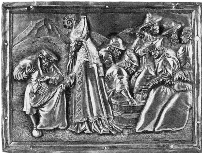
Freiburg, Münsterschatz: Kleines Relief (12,2 × 16,4 cm) mit der Szene der wunderbaren Be- schaffung von Korn in der Hungersnot aus der Vita des Nikolaus v. Myra. Vermut- lich Rest einer grossen Sil- berstatue des Augsburger Goldschmieds Silvester Nathan, zwischen 1514 und 1518.

praktisch stehengebliebene Forschung über die Freiburger Goldschmiede generell wieder aufzunehmen ist. Überdies führte die Veröffentlichung von Montenachs Schatzverzeichnis aus dem Jahre 1661 zur Feststellung, dass die umfangreichen Archivalien zum Münsterschatz weitgehend brachliegen 1 . Im Rahmen der Ausstellungsvorbereitung konnten die Schatzverzeichnisse und die Kirchmeierrechnungen weitgehend systematisch aufgearbeitet werden. Die Ausstellung und der hierzu erarbeitete (durchgehend zweisprachige) Katalog konnten die vielschichtige Arbeit punktuell nachholen, wollen jedoch in erster Linie der weiteren Forschung Anregung und Ansporn sein.