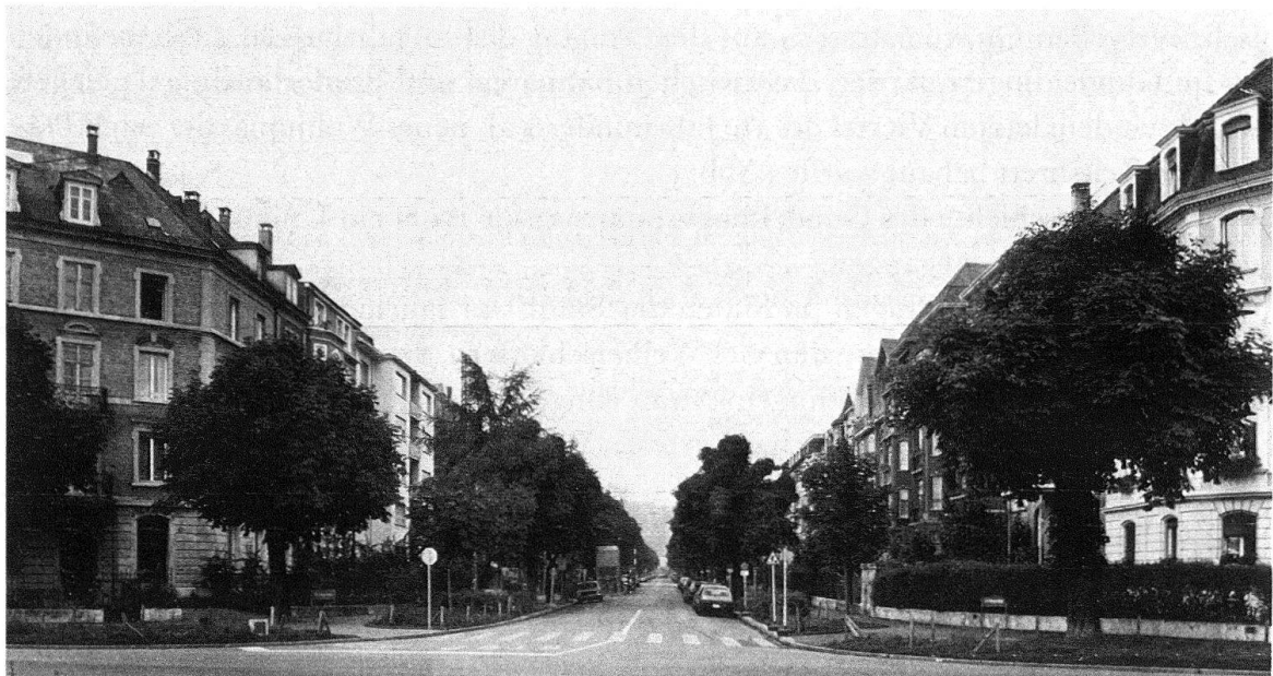
Abb. 2. Basel. Blick vom Bahnareal her in die Delsbergerallee und gegen das Bruderholz

Aus dem Ratschlag geht hervor, dass damals lediglich die quartierbegrenzenden Strassen, Münchensteiner- und Gundeldingerstrasse einerseits und Reinacher- und Margarethenstrasse andererseits, samt drei rechtwinklig dazu laufenden Querstrassen bestanden. Die nun neu geplanten Strassen und Plätze wurden auf Kosten der Immobilien-Gesellschaft erstellt. Zu ihnen gehört auch die Delsbergerallee, die wie die Thiersteinallee mit Bäumen versehen wurde, denn, wie der Ratschlag vermerkt: «auch für