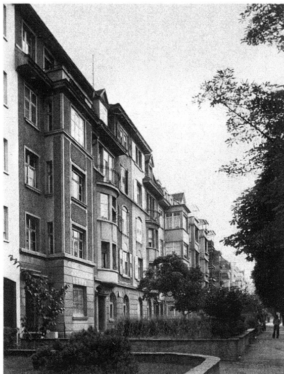
Abb. 3 und 4. Basel. Delsbergerallee 16–8 (von links nach rechts) und 11–27

diese besonders schöne Strasse erwartet man Liebhaber, die auf stattlichere Liegenschaften reflektieren». Nach Zustimmung des Grossen Rates begann die Gesellschaft 1874 mit dem Wiederverkauf des Bodens, der bis 1901 beendet war 2 .