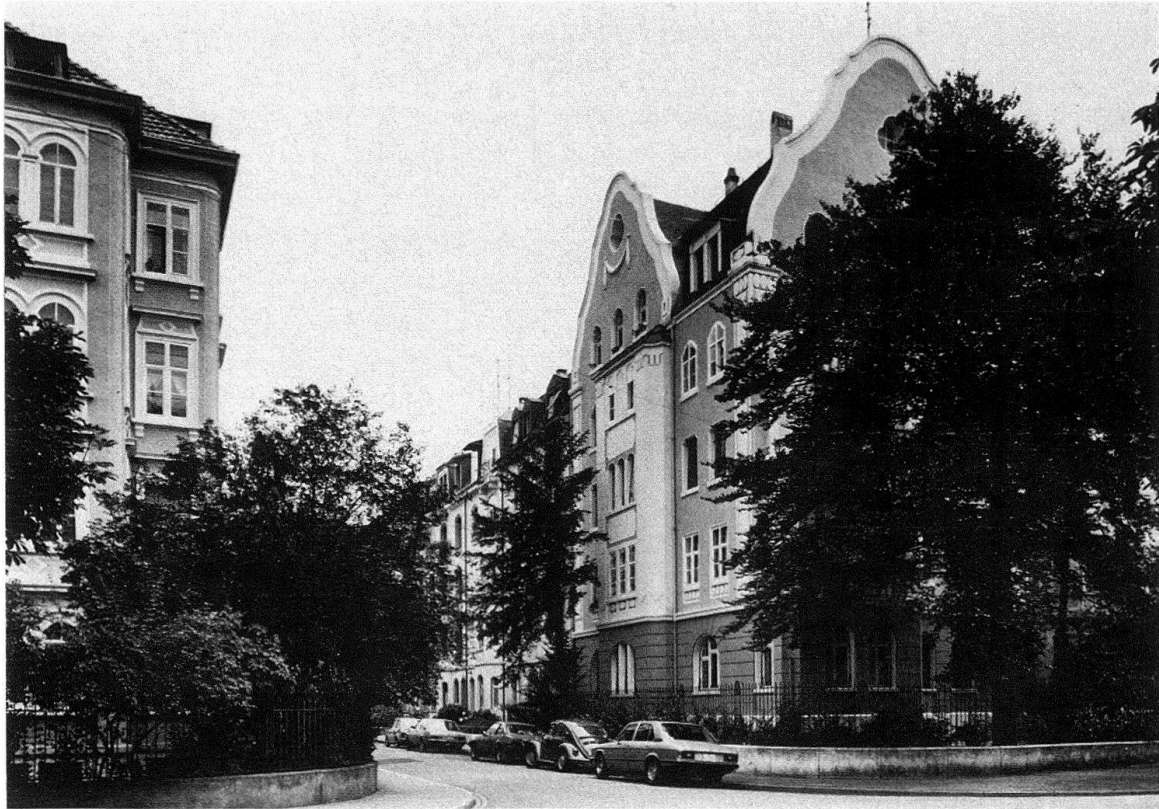
Abb. 5. Basel. Delsbergerallee 41, von Gustav Doppler, 1908

Leider blieb auch die Delsbergerallee nicht ganz von baulichen Eingriffen verschont. Der Basler Zonenplan von 1939, der der Stadt massive Aufzonungen brachte, sah für die Delsbergerallee die Bauzone 5a vor, die damals fünf Vollgeschosse erlaubte; in der Hochkonjunktur wurden jedoch zusätzlich ein Sockel- und ein Attikageschoss erlaubt, so dass nun eigentlich sieben Stockwerke möglich wurden. Dies bedeutete Anreiz zu Abbruch und Neubau. So überragen heute einige unschöne Neubauzähne das Gruppenbild.