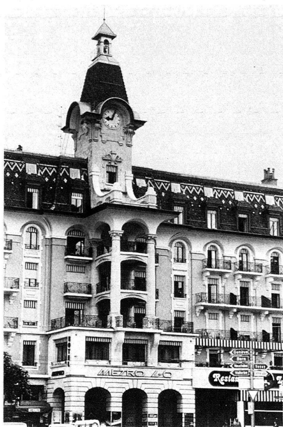
Lausanne-Ouchy. A gauche : Hôtel Beau-Rivage, annexe 1908, grande coupole, vitraux par E. Diekmann. – Ancien Hôtel du Parc (1906) par Francis Isoz