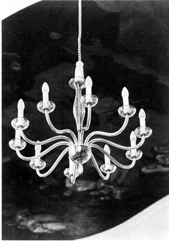
Vorderthal SZ, kath. Pfarrkirche. Kronleuchter aus Glas in barockem, aber stark verändertem Raum, 1979.

Ein Kapitel für sich ist die «Lichtersäufung» jener historischen Räume, die als Büros benutzt werden. Hier zeichnet sich ein Kollisionskurs ab, der meistens mit einem hässlichen Provisorium endet. Dabei würde, mit gutem Willen des Bürobienutzers, auch ein «wohnlicheres» Licht vollauf genügen. Aber der Büromensch müsste seine «Neon-Augen» ein bisschen umstellen, und das will er nicht.