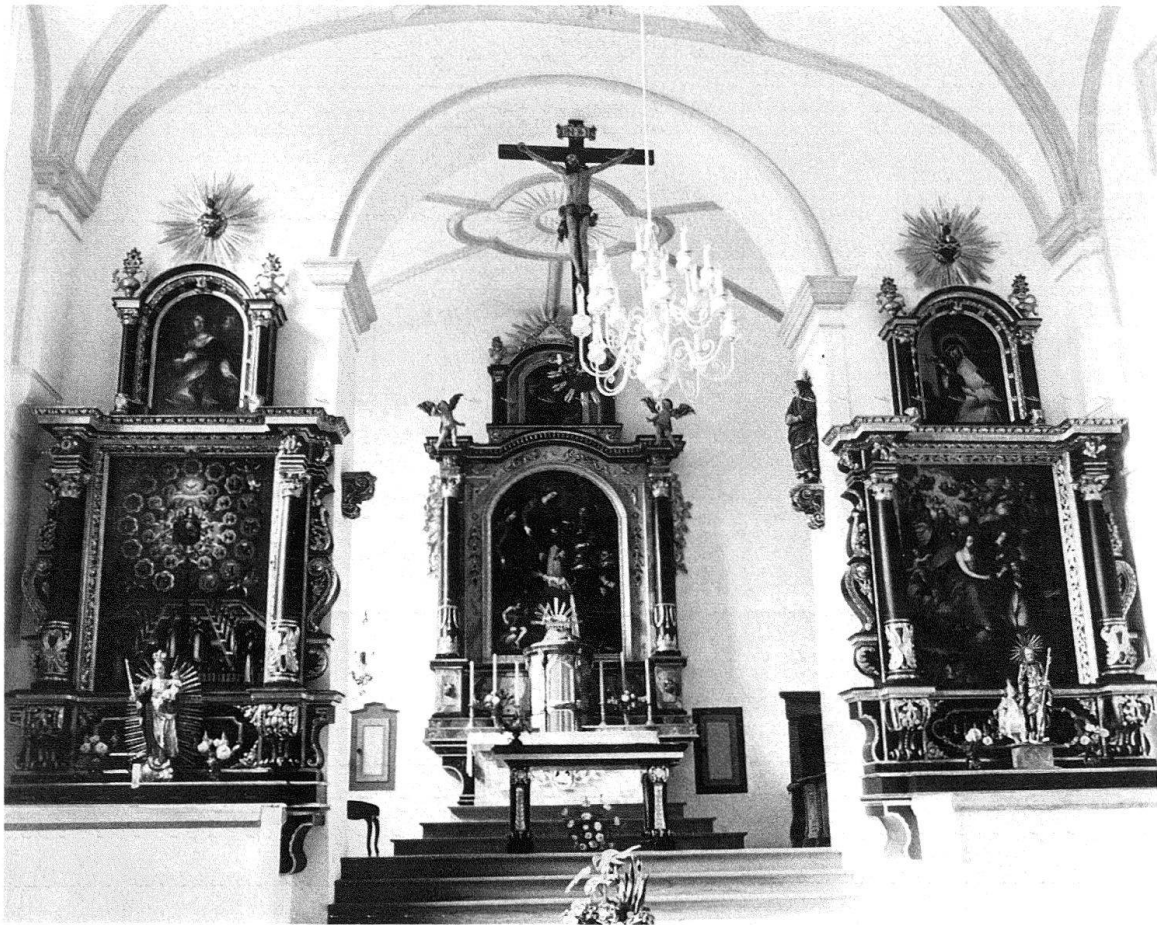
Weesen SG, Kirche des Dominikanerinnenklosters Maria Zuflucht, um 1690, nach Restaurierung 1979. Kronleuchter aus Metall, elfenbeinweiss gestrichen. «Holländer» in zentraler Stellung – integrierende Lösung.

Das sollte sich schnell ändern. Je nüchterner die bauliche Umgebung wurde, desto sachlicher wurde auch die Beleuchtung. Der Mensch begnügte sich nicht mehr mit schönen Einzelleuchtern, sondern strebte eine globale Ausleuchtung an. Die Technik tat das Ihre, um die Nacht zum Tag werden zu lassen. Die kommerzielle Architektur, etwa die modernen Warenhäuser, verzichtet heute sogar auf Fenster. Künstliches Licht ersetzt die Sonne. Der Mensch wird an vielen Arbeitsstellen dem Tagesablauf entfrem-