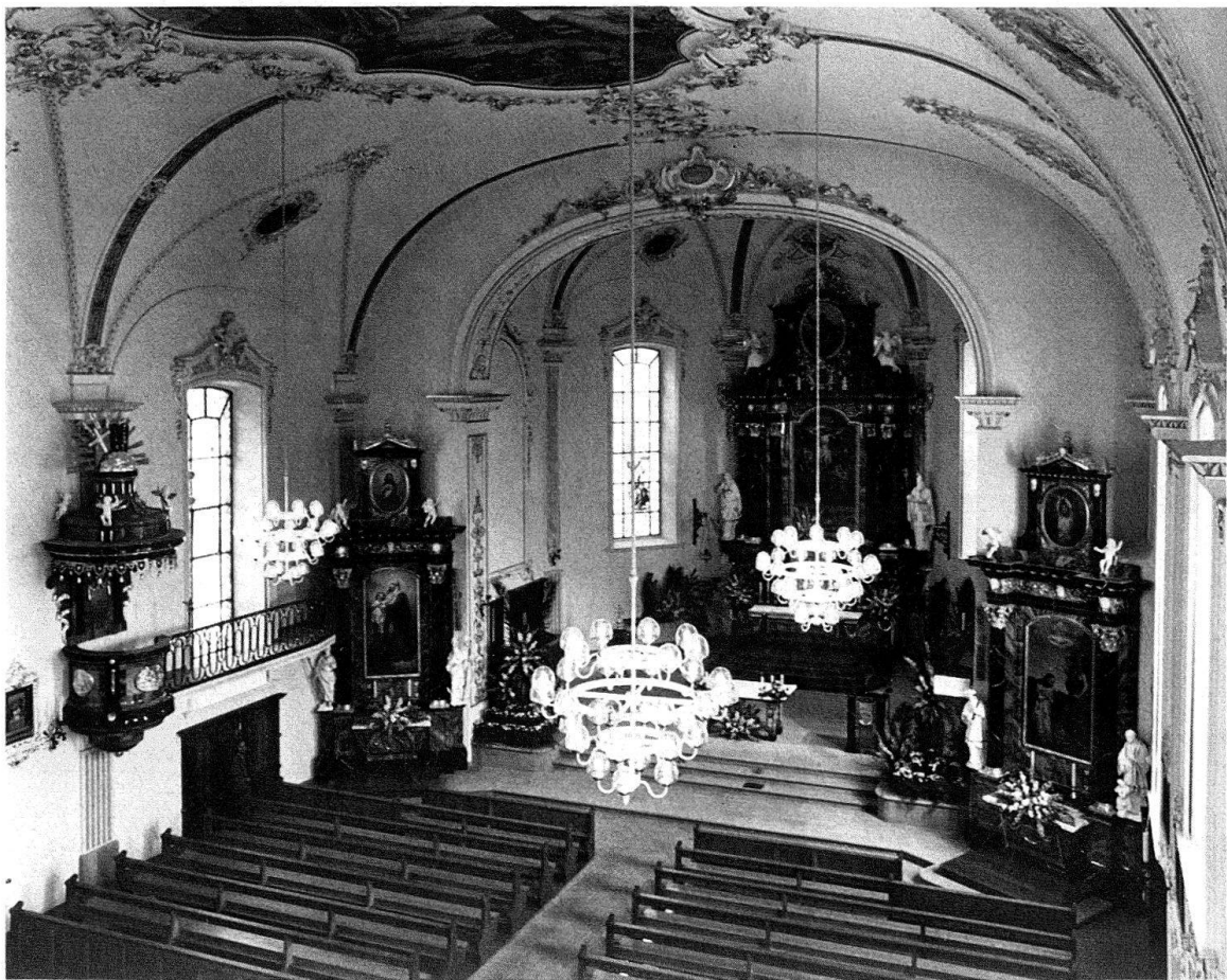
Oberriet SG, kath. Pfarrkirche. Neubarock gestalteter Raum mit klassizistischer Ausstattung, nach Restaurierung 1978. Tiefgehängte moderne Leuchter mit optischem Eigengewicht. Entwurf Architekturbüro Rausch-Ladner-Clerici, Rheineck.

Die Denkmalpflege sieht sich vor allem in künstlerisch aufwendigen Räumen mit Belichtungsproblemen konfrontiert, in historischen Gotteshäusern und in repräsentativen Profanräumen. Hier wie dort trifft man kaum auf alte Lichtträger, weil sie vielleicht gar nie vorhanden waren oder später ersetzt wurden. Fast bei jeder Restaurierung wird die Beleuchtung zu einem Kernproblem: auf der einen Seite steht das Lichtwunschdenken des Bauherrn, auf der andern Seite das raumzutragliche Mass an Licht und Lichtkörpern. Es geht nämlich nicht nur um die formale Integration der Lampen, sondern auch um die Lichtverteilung und Lichtintensität. Mit zu viel Licht kann man die architektonischen Qualitäten eines Raumes zunichte machen.