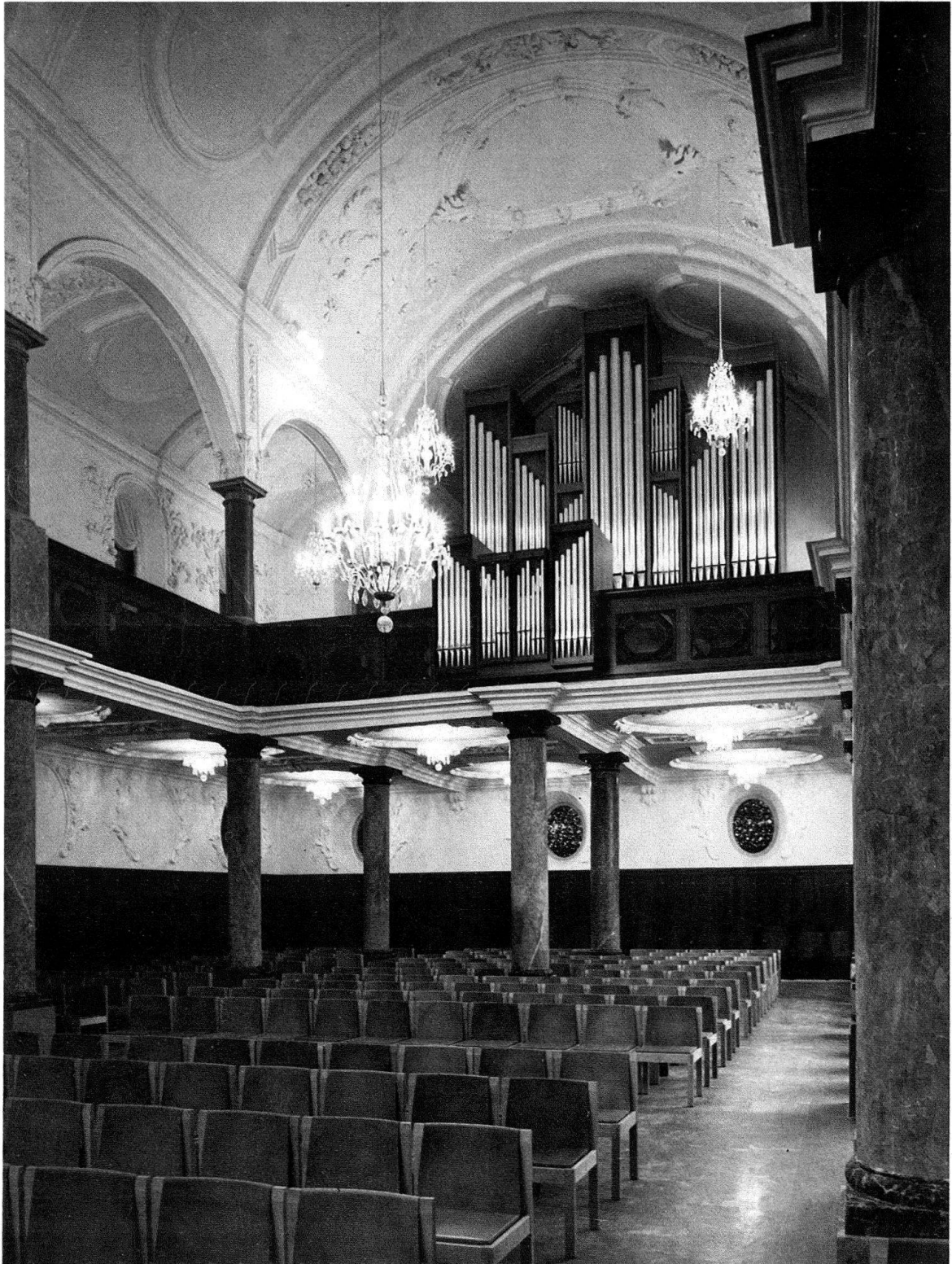
Zürich, Kirche St. Peter. Eine Beleuchtungsanlage, die sich gleichsam aus den Decken, den Raumachsen und den gottesdienstlichen Bedürfnissen ergab. Die Leuchterform (1714), seine Viellammigkeit und sein Spektrum lassen den barocken Stuck wieder erleben und geben dem Raum seine ursprüngliche Festlichkeit zurück. – Architekt: Peter Germann, BSA/SIA, Zürich. – Experten: Prof. Dr. Albert Knoepfli, Frauenfeld. Walter Burger †, Städtische Denkmalpflege, Zürich. Dr. Walter Drack, Kantonaler Denkmalpfleger, Zürich. Adolf Wasserfallen, Stadtbaumeister, Zürich