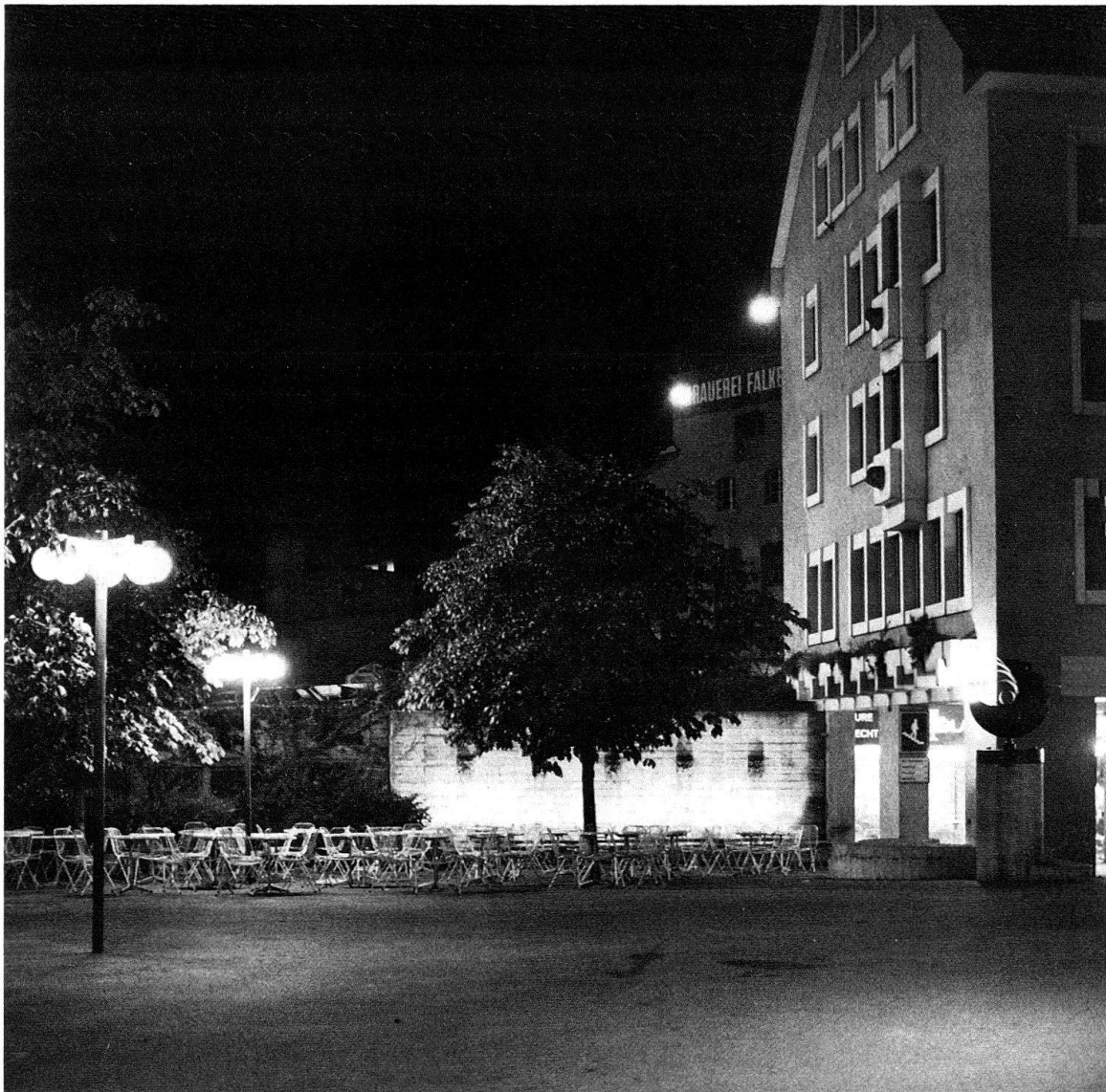
Baden, Cordulaplatz. Sachlicher Kopfbau als Abschluss einer historischen Häuserzeile mit Vorplatz im Fussgängerbereich. – Architekt: A. Liesch, BSA/SIA, Zürich + Chur; Städtisches Hochbauamt, Baden

Für den Helligkeitseindruck in einem Raum zeichnet jedoch nicht alleine die Lichtstärke verantwortlich. Wichtig ist auch, wie er die «Lichtsendung» empfängt. Je nach Farbe und Oberflächenstruktur wirft die Architektur Licht wieder zurück oder «verschluckt» einen Teil davon. Das lichttechnische Ergebnis dieses Verhaltens bezeichnet man als Leuchtdichte . Ausserdem kommt, besonders in historisch-polychromen Bauten, der Lichtfarbe und ihrem Einfluss auf die Körperfarbe wie auf das gesamte Raumklima hohe Bedeutung zu. Nicht gleichgültig ist auch die Lichtart ; hier gilt es auch allfällige Schädigungen zu bedenken. Der Ultraviolettanteil von Fluoreszenzlicht kann eine chemische Reaktion der Pigmente auslösen; sie bleichen. Die Infrarotwärme der üblichen Glühlampen ist imstande, Farben rissig oder blasig auszutrocknen oder gar anzusenken. Zudem erzeugt Wärme eine Luftzirkulation, welche Staub, Fettpartikel usw. transportiert und der Verschmutzung Vorschub leistet. Im Gegensatz zur Bleichung kann