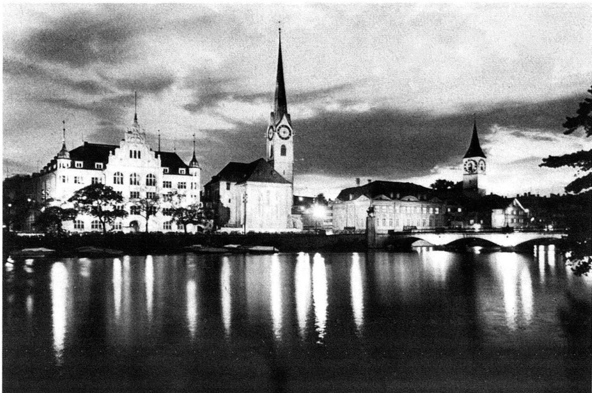
Zürich. Das linke Limmatufer mit (von links) dem Stadthaus, Fraumünster, Zunfthaus zur Meisen und dem Turm von St. Peter: Beispiel einer die Architektur auslaugenden Tendenz der «An- und Ausleuchtung»

Das weist auf das Gedankengebäude mittelalterlicher Lichtmystik, auf die Bedeutung des Lichtes im Kathedralbau, wo es mit Mass und Zahl zum platonisch-metaphysischen Sinnbild göttlicher Ordnung zusammenwuchs. Die steinernen Gebirge von