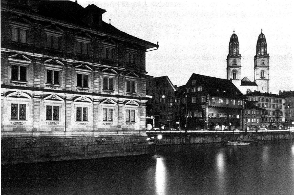
Zürich. Das rechte Limmatufer: vom Rathaus (links) bis zur Doppelturmfassade des Grossmünsters: Beispiel eines massvollen Einsatzes der Aussenbeleuchtung

Menschenhand wurden durchlässig und von ihm durchdrungen und gaben im Wirken dieser materienfernsten Naturkraft ihre Materienschwere auf. Auch das Kunstlicht stand nicht ausserhalb des Gleichnishaften: das himmlische Jerusalem lebte im Lichtkranz gotischer Kron- und Radleuchter, und das Lichtgeflimmer unzähliger Lampen etwa in der Hagia Sophia vereinigte sich zum Symbol allen Leuchtens und aller Harmonie in Gott.