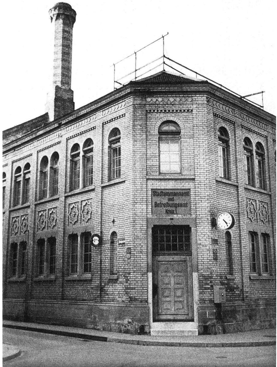
Bad- und Waschanstalt in Winterthur, um 1860 von Stadt- baumeister Karl Bareis erbaut

Joos angeführt. Daxelhoffer entwarf damals gerade das Hotel «Schweizerhof» in Bern und Joos das Hauptrestaurant für die Schweizerische Landesausstellung 1914.