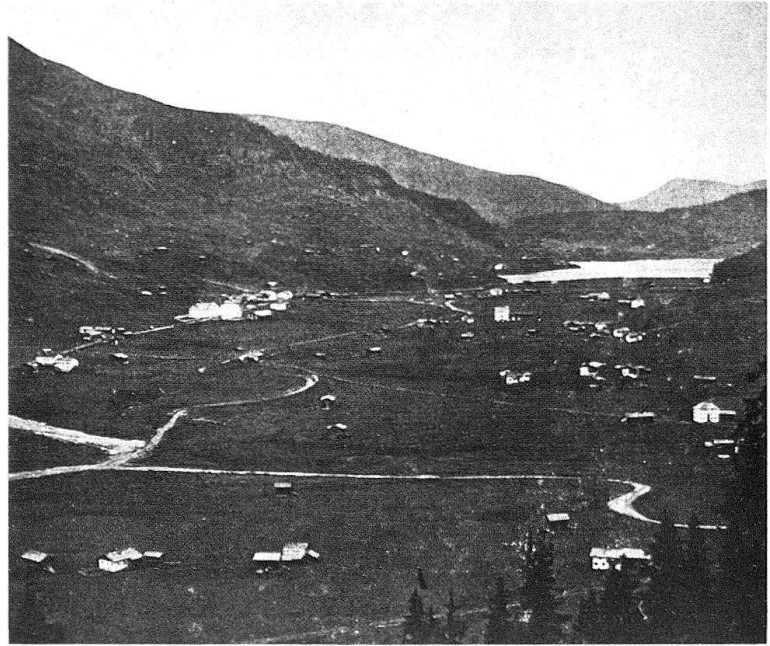
Abb. 1. Davos-Dorf und der Davosersee, um 1865

Heizung, Bühneneinrichtung, Küche und Vorratshaltung, zur inneren Erschliessung und zur Verwaltung zu finden.