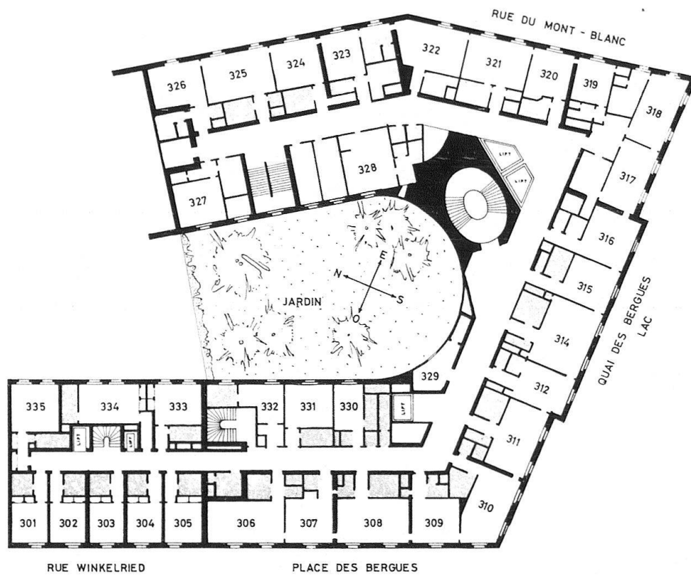
Fig. 3. Genève. Plan schématique actuel de l'Hôtel des Bergues (3 e étage)