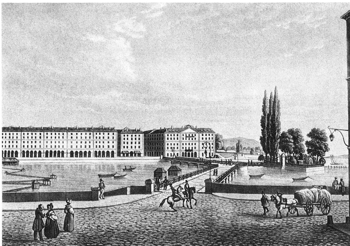
Fig. 1. Genève. Les maisons du quai des Bergues et l'hôtel d'après une gravure faite peu après leur achèvement (1834). Au premier plan, le Grand Quai et le pont des Bergues; à droite, l'île Rousseau