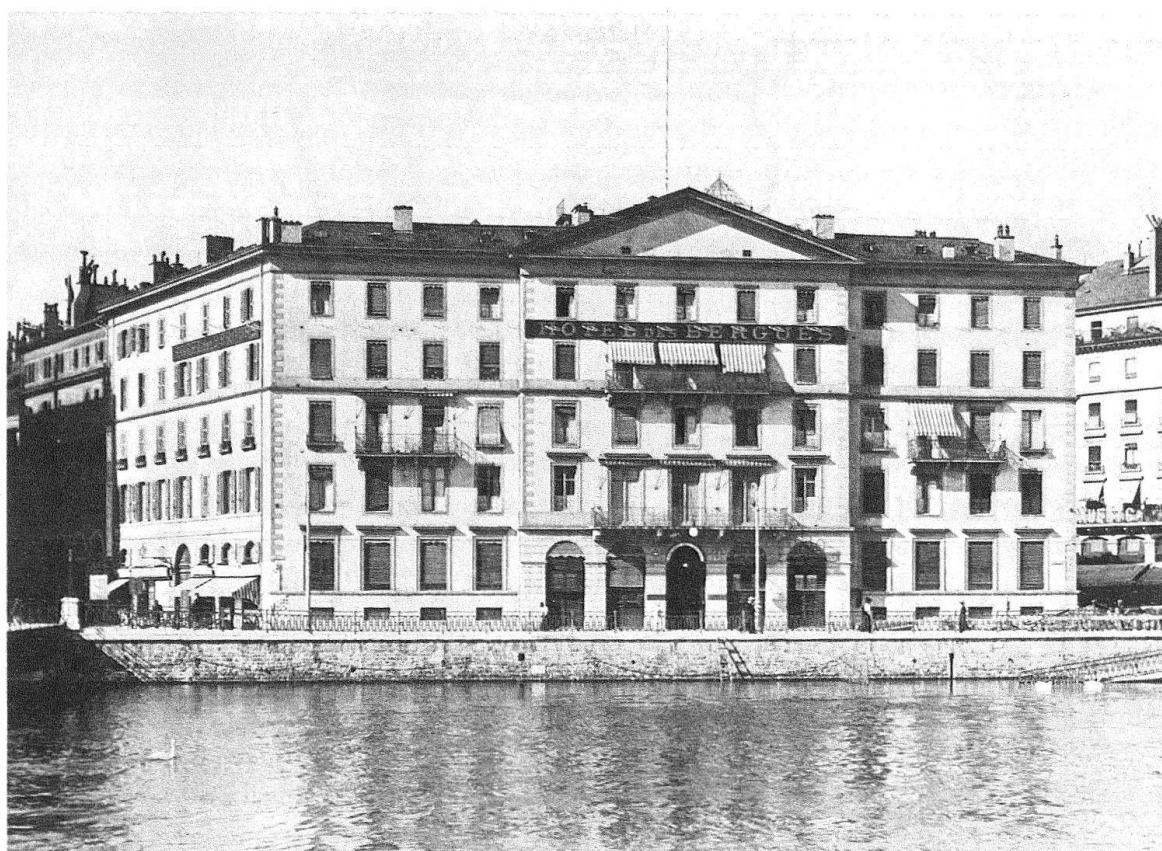
Fig. 5. Genève. L'Hôtel des Bergues sous son ancien aspect d'après une photographie de la fin du XIX e siècle

Depuis les travaux de 1917 le bâtiment se présente sous un aspect tout autre (fig. 6). A la sobriété a fait place l'emphase. L'hôtel a été surélevé d'un étage entier en forme d'attique ; la toiture refaite a pris des proportions beaucoup plus importantes. Des pilastres ioniques colossaux sur trois étages flanquent la partie centrale. On a ajouté systématiquement des balcons un peu partout. Les ouvertures du bâtiment ont pratiquement toutes été redessinées : au rez-de-chaussée, de grandes baies rectangulaires ont pris la place des anciennes fenêtres, au premier étage les baies ont été agrandies et cintrées, ailleurs des larmiers ont été rajoutés.