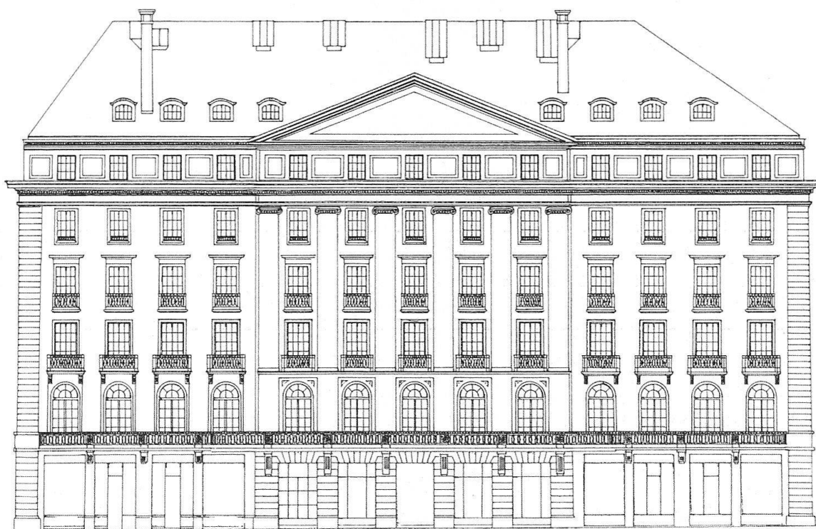
Fig. 6. Genève. Façade principale de l'Hôtel des Bergues relevée par le Bureau d'entraide technique en 1940

Conclusion : l'Hôtel des Bergues fut un des pionniers de l'hôtellerie suisse . Premier établissement de luxe genevois il souhaitait offrir à ses hôtes toutes les commodités alors à l'avant-garde. Un prospectus de publicité de l'hôtel de 1835 et un autre de 1844 12 nous donnent toutes sortes d'indications précieuses sur les avantages dont pouvait bénéficier la clientèle. Les voitures et équipages des voyageurs étaient soignés par des palfreniers. Ceux qui le désiraient pouvaient louer des «calèches à deux chevaux», des «chars à un cheval» ou simplement des «chevaux de selle» pour les promenades et excursions dans les environs. Les journaux et revues étaient à disposition des lecteurs dans les «salons de compagnie chauffés et éclairés» ou dans le «salon de lecture». Les repas se prenaient à la salle à manger à «table d'hôte» ou «en particulier» – ce qui revenait plus cher – et l'on y dégustait des «mets apprêtés à l'anglaise ou à la française». On pouvait aussi se faire servir en chambre. L'hôtel ne comportait, semble-t-il, pas de lieux équivalents à des salles d'eau, puisque les clients prenaient des bains de pied dans leurs chambres. On payait en plus les bougies et les feux de cheminées (chaque chambre était pourvue d'une cheminée) que l'on faisait brûler.