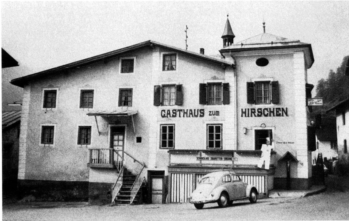
Müstair GR. Hotel Hirschen vor und nach der Restaurierung. Das den Platz Grond massgeblich prägende Gebäude ist im ersten Drittel unseres Jahrhunderts umgebaut und mit einem turmartigen Aufbau versehen worden. Bei der Fassadenrestaurierung von 1974 entdeckte man eine originale Sgraffitodekoration von 1613, welche wiederhergestellt wurde und die Rekonstruktion der ursprünglichen Fensterdisposition gestattete. Auf die ursprüngliche Dachneigung, die von der Dekoration markiert wird, konnte man aus Nutzungsgründen nicht zurückgehen.