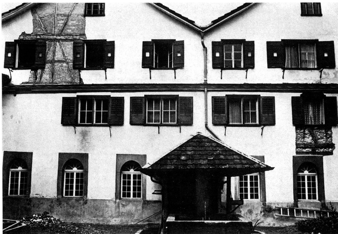
MAGDENAU SG. Zisterzienserkloster. Die den Innenhof (Kreuzgang) umstehenden Gebäude sind grossenteils Riegelbauten. Unsere Bilder zeigen die Südseite des Innenhofes vor der Restaurierung mit dem verputzten Riegelwerk und die Nordseite nach der Restaurierung mit dem freigelegten und instandgesetzten Riegelwerk.