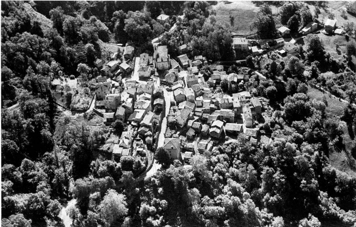
MUGENA TI. 1974 wurde die Pfarrkirche entfeuchtet, ihr Turm und ihre Fassade restauriert. Die Aufnahme zeigt die Bedeutung der Kirche für das Ortsbild, andererseits die Wichtigkeit der Häuser und der Landschaft als ideale Umgebung der Kirche. Die Eidgenössische Kommission für Denkmalpflege hat sich je länger, je mehr auch mit Fragen des Umgebungsschutzes zu befassen. Auf diesem Gebiet arbeitet sie mit der Eidgenössischen Natur- und Heimatschutzkommission zusammen.

MARTIGNY VS. Octodurus. Notgrabungen im Gebiet des römischen Forums. Winterschutz für die römischen Thermen.