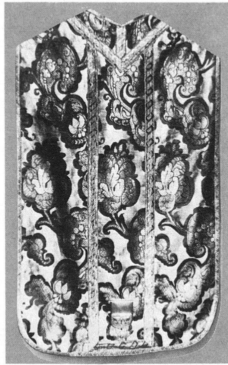
Abb. 4. Kasel des Fugger-Ornates von 1719 in Fischingen, heute Rickenbach TG