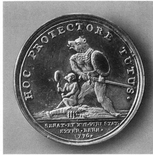
Abb. 7. Sechzehnerpfennig des Äusseren Standes, Silber, 1776, Historisches Museum, Bern

ersteigert werden. Das rechteckige Tischblatt mit den abgeschrägten Ecken ziert in der Mitte eine eingelegte Wappenkartusche unter einer Standeskronen (Abb. 8). Hier haben wir wiederum das Emblem mit dem Krebs und dem darauf sitzenden Affen, der nun im Gegensatz zu den vorangehend behandelten Darstellungen auf dem Spiegel und dem Ehrentrinkgefäss wiederum einen Apfel in der linken Hand hält. Bandwerk, Maskarons, Kriegstrophäen, wie Kanonen, Fahnen, Stangenwaffen, mit Kanonenkugeln angefüllte Fässer und Kesselpauken, bilden das dicht gedrängte und symmetrisch geordnete Rahmengefüge, das seine Entstehung den dreissiger Jahren des 18. Jahrhunderts verdankt. Dass dieser Tisch einer Funkschen Werkstatt zugeschrieben werden darf, wie es im Auktionskatalog 19 geschah, scheint mir nicht ohne weiteres auf der Hand zu liegen und sei vorerst noch in Frage gestellt.