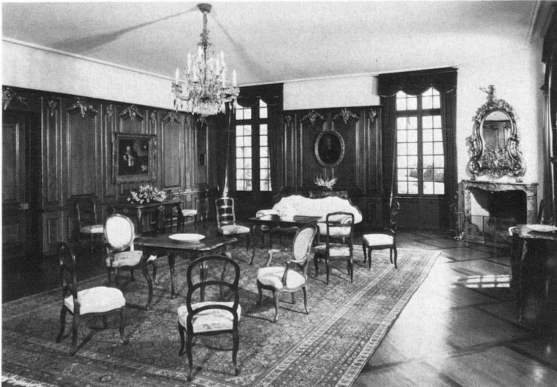
Abb. 2. Schloss Oberhofen, Gesamtansicht des Gartensaales

Nach einer zweijährigen Bauzeit, die 1728 begann, konnte der Äussere Stand an Ostern 1730 erstmals in dem neu erbauten Rathause zusammentreffen. Nach Paul Hofer soll der Berner Architekt Albrecht Stürler der Erbauer des Rathauses gewesen sein. Im Juni 1729 erging der Auftrag an die Tischmacher Edelstein und Fehr zur Anfertigung der Wandvertäferung aus Eichenholz für die Ratsstube im Hauptgeschoss. Dem Zusammenbruch des bernischen Staates, des sog. «Ancien Régime», im Frühjahr 1798, fiel auch die Institution des Äusseren Standes zum Opfer. Im folgenden Jahr übernahm die Stadt Bern das Haus samt Aktiven und Passiven der schwerverschuldeten Gesellschaft, denn von den erheblichen Baukosten hatte sich der Äussere Stand während des ganzen 18. Jahrhunderts nicht erholt. Das gesamte Inventar mit dem kostbaren Mobiliar gelangte zur Versteigerung und wurde ziemlich auseinandergerissen. 1817 erfuhr dann die Ratsstube unter dem neuen Besitzer eine Umgestaltung mit einer neuen Wandverkleidung durch Tapeten aus Lyoner Seide, so dass für die Wandvertäferung von 1729 ein neuer Platz im Nordostzimmer des Erdgeschosses gefunden werden musste. 1904 gelangten schliesslich die Überreste dieser Vertäferung ins Bernische Historische Museum. Nach fünfzig Jahren endlich zeigte sich in Schloss Oberhofen die Möglichkeit einer neuen Verwendung.