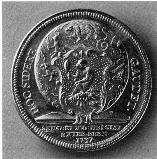
Abb. 1. Sechzehnerpfennig des Äusseren Standes, Gold, 1737, Historisches Museum, Bern