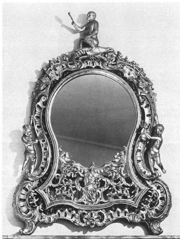
Abb. 3. Spiegel des Äusseren Standes, um 1740–1750, Schloss Oberhofen

Zweifelsohne ist der vergoldete Spiegel das schönste der wenigen erhaltenen Ausstattungsstücke aus dem Rathaus des Äusseren Standes (Abb. 3). Seine äussere Form sieht einer Pendule ähnlich. Eine figürliche Plastik bekrönt das reich verzierte Rah-