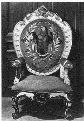
Abb. 11. Ehemaliger Fauteuil des Landvogtes auf Habsburg im Äusseren Stand, um 1730. Bogenschützengesellschaft, Bern