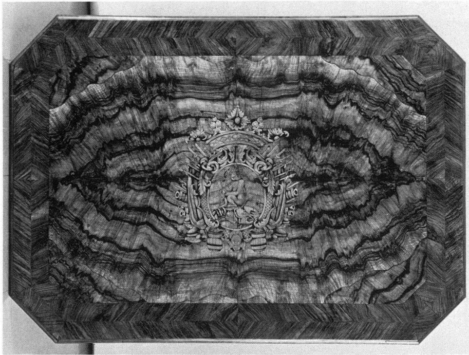
Abb. 8. Tisch mit eingelegtem Emblem des Äusseren Standes, um 1730–1740. Schloss Oberhofen