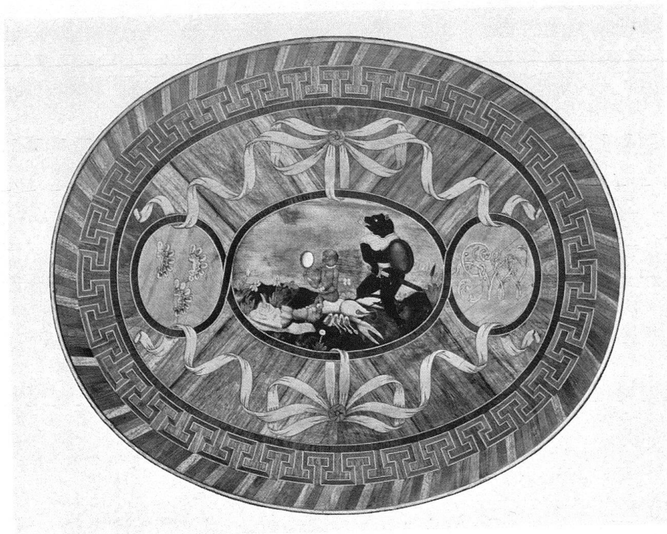
Abb. 9. Ovalschisch mit eingelegtem Emblem des Äusseren Standes, Stil Louis XVI, um 1780. Schloss Oberhofen