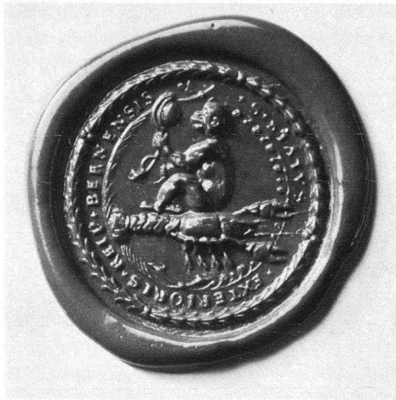
Abb. 4. Siegel des Äusseren Standes, 1635. Historisches Museum, Bern

menwerk. Es ist ein Affe, der auf dem Rücken eines Krebses sitzt und in einen Spiegel schaut. Hier handelt es sich um das Emblem des Äusseren Standes. Aus dem Rahmenwerk oberhalb der S-förmigen Flanken ragt seitlich je ein Affenkopf hervor, einen Dreispitzhut tragend, und auf der S-Flanke steht beidseitig je ein Putto. Derjenige rechts, durch die kurzgeschnittene Haartracht eindeutig als ein Knabe gekennzeichnet, hält in der linken Hand eine Maske, derjenige links scheint mit langem herabfallendem lockigem Haar weiblichen Geschlechts zu sein. Er hält in der rechten Hand einen Fächer. In dem durchbrochenen Rocaillegefüge des mittleren Teiles sitzt eine Minerva mit Speer und einer Eule im linken Arm. Während Hofer die Ansicht vertritt, dass der Spiegel aus der Bauzeit der Ratsstube stammt, also etwa um 1729/30 zu datieren wäre, glaube ich eher an eine spätere Entstehungszeit, um 1740–1750, wobei ich einen Rahmenschnitzer vermute, der Johann Friedrich Funk nahestand, wenn nicht sogar er selbst der Meister dieser vorzüglichen Schnitzerei gewesen ist.