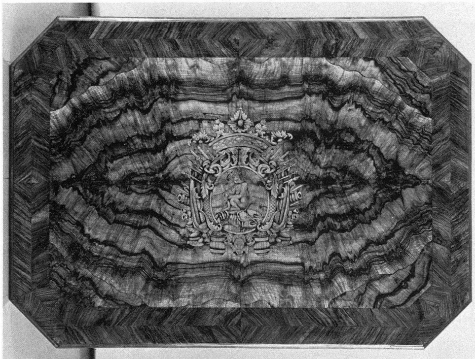
Abb. 8. Tisch mit eingelegtem Emblem des Äusseren Standes, um 1730–1740. Schloss Oberhofen