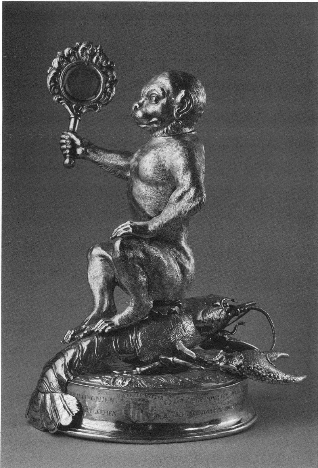
Abb. 5. Emanuel Wyss: Silbervergoldetes Ehrengeschirr des Äusseren Standes, 1678. Zunft zum Affen, Depositum im Historischen Museum, Bern