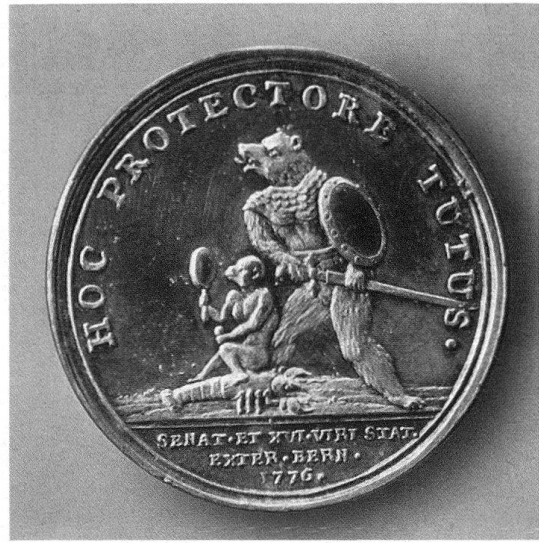
Abb. 7. Sechzehnerpfennig des Äusseren Standes, Silber, 1776, Historisches Museum, Bern

ersteigert werden. Das rechteckige Tischblatt mit den abgeschrägten Ecken zielt in der Mitte eine eingelegte Wappenkartusche unter einer Standeskronen (Abb. 8). Hier haben wir wiederum das Emblem mit dem Krebs und dem darauf sitzenden Affen, der nun im Gegensatz zu den vorangehend behandelten Darstellungen auf dem Spiegel und dem Ehrentrinkgefäss wiederum einen Apfel in der linken Hand hält. Bandwerk, Maskarons, Kriegstrophäen, wie Kanonen, Fahnen, Stangenwaffen, mit Kanonenkugeln angefüllte Fässer und Kesselpauken, bilden das dicht gedrängte und symmetrisch geordnete Rahmengefüge, das seine Entstehung den dreissiger Jahren des 18. Jahrhunderts verdankt. Dass dieser Tisch einer Funkschen Werkstatt zugeschrieben werden darf, wie es im Auktionskatalog 19 geschah, scheint mir nicht ohne weiteres auf der Hand zu liegen und sei vorerst noch in Frage gestellt.