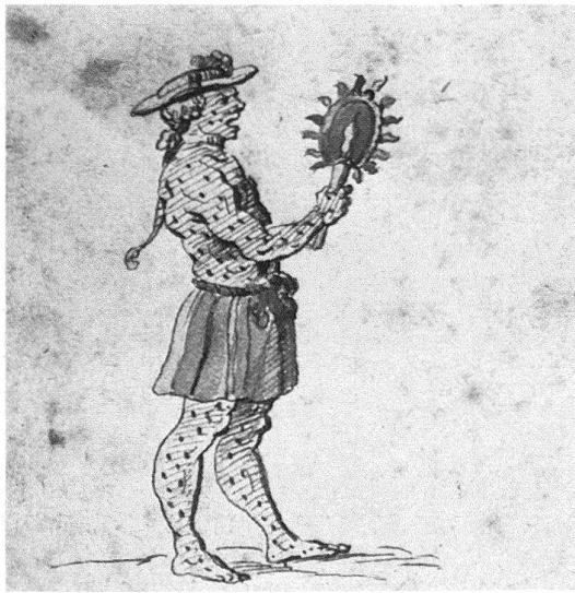
Abb. 6. Affenkleid- und Bärenkleidträger, Detail aus dem Ostermontagsumzug des Äusseren Standes. Federzeichnung, Mitte 18. Jahrhundert. Historisches Museum, Bern