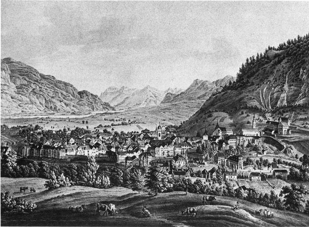
Abb. 1. J. S. Steingrübél: Vue de la ville de Coire en Suisse. Um 1840. Kolorierte Unrissradierung 32,5 × 45 cm

Die Stadt Chur ist Hauptstadt des 1803 gebildeten Kantons Graubünden; doch auch zur Zeit des Freistaates der Drei Bünde, also seit dem späten Mittelalter, war sie wichtiger Vorort. Ihre Bedeutung verdankt sie der Verkehrslage: hier, beim Austritt der Plessur ins Rheintal, teilt sich die Deutsche Strasse in die Obere Strasse mit Julier und Septimer und in die Untere Strasse durch das Rheinwald über Splügen und Bernhardin einerseits und Vorderrhein, Lukmanier anderseits. Beim Hof vorbei zog man ins Schanfigg, über Strela, Davos bis ins Münstertal. Die alte römische Siedlung, welche über Schichten mit Besiedlungsspuren seit der Jung-Steinzeit errichtet wurde, lag auf dem westlichen Ufer der Plessur im Welschdörfli, doch konnten vor kurzem auch auf dem Hof eine wahrscheinlich römische Mauer und eine frühmittelalterliche Kastellanlage nachgewiesen werden.