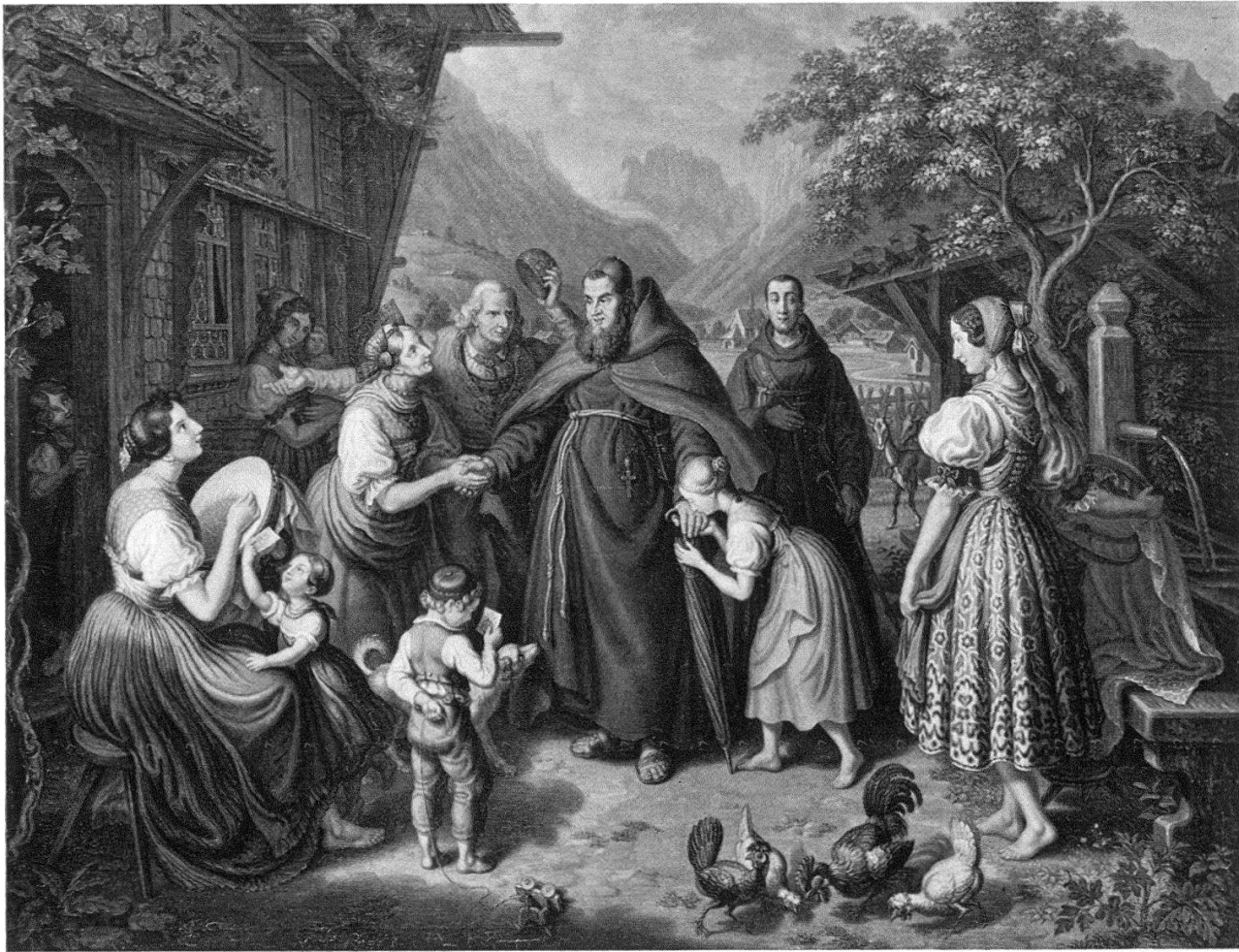
Abb. 1. Ludwig Vogel. Kapuziner im Dorf (Kunstmuseum Solothurn)

Täfelung mit Feldern und Friesen, vierteilige Butzenfenster und Scheiterbeige, Blumenbrett und Weinrebe 4 . Die Einfügung der Tür in die Mitte des Blockhauses entspricht allerdings nicht den örtlichen Baugewohnheiten, sondern kompositionellen Gründen, und unter den Stubenfenstern fehlt die Ladenverkleidung. Die dekorativ ausgebreiteten Pflanzen in den untern Ecken rufen Erinnerungen an die Dürerzeit wach. In der Faltengebung – man beachte etwa den Rock der sitzenden Stickerin – hallen noch barocke Anklänge nach. Dem Interesse am Detail entspricht eine zeichnerische Grundhaltung mit einem feinen Sinn für die Schönlinigkeit des Umrisses, wie sie vor allem in der Gestalt der stehenden Stickerin zutage tritt. In seiner bunten Lokalfarbigkeit gemahnt das Bild an einen kolorierten Stich, die schwärzlichen Schatten erzielen Aquatintawirkung.