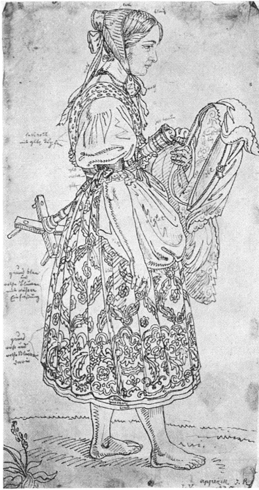
Abb. 4. Ludwig Vogel. Appenzeller Stickerin, Federpause (Schweizerisches Landesmuseum Zürich)