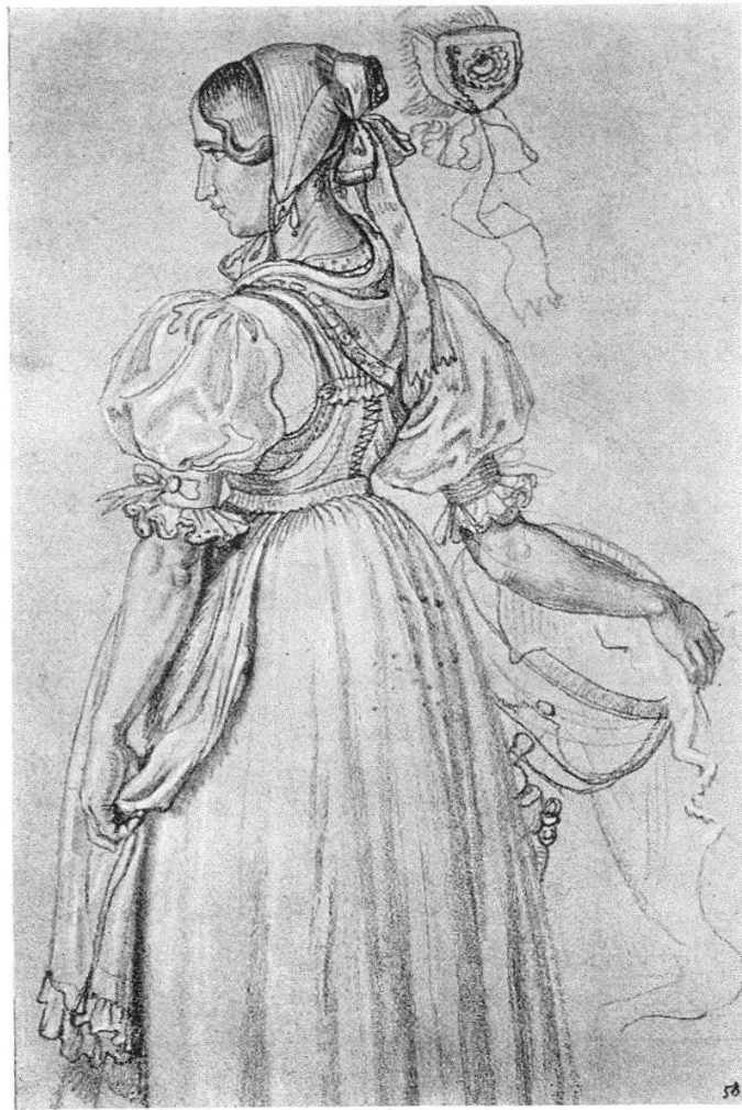
Abb. 5. Ludwig Vogel. Detailstudie zur Stickerin rechts (Schweizerisches Landesmuseum Zürich)

Ainsi, un tableau du Musée des beaux-arts de Soleure, intitulé «Les capucins au village» (1854), donne une bonne idée de cette peinture de genre, proche ici de la tradition populaire. On y voit deux capucins quêteurs, reçus par une famille de paysans d'Appenzell. L'œuvre est réaliste dans ses détails; sa qualité principale réside cependant dans la composition qui tire parti d'éléments mineurs, mais habilement agencés.