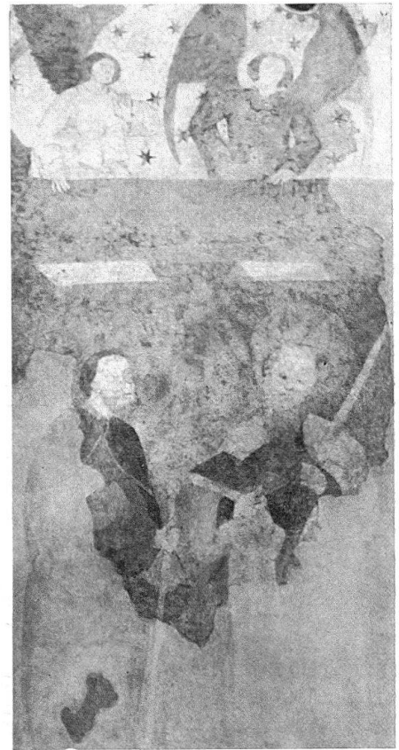
Gelterkinden, Reformierte Kirche. Details der Wandmalereien im Chor: Engel und Heilige (links), Jakobus d. Ae. und Paulus (rechts)

Johannes dem Täufer steht in der Leibung die heilige Margaretha, erkennbar am Drachen zu ihren Füßen. Links von Maria glaubt man eine Figur mit einem Kirchenmodell in der Hand zu sehen, wahrscheinlich Kaiser Heinrich, dessen Namen auch eine Kaplanei der Kirche im 15. Jh. trug. Links davon im gleichen Fenster eine Figur mit einem Hund zu Füßen, vermutlich der heilige Wendelin.