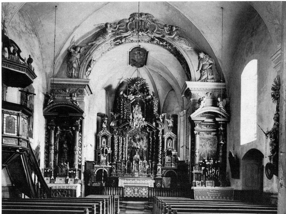
Lumbrein. Pfarrkirche St. Martin, Haupt- und Nebenaltäre

Der Bau selbst belohnte den großen Einsatz, der zu seiner Erhaltung und Wiederherstellung gewagt worden war. Hatte ein erster Fund die architektonische Form der Restaurierung bestimmt, so sollte ein zweiter Fund über die farbliche Fassung entscheiden. Das Bauwerk restauriert sich selbst, sagte Linus Birchler wiederholt: dies hat sich auch in Lumbrein wieder bewahrheitet. Unter den Händen der Restauratoren Stöckli aus Stans enthüllte das ganze Chorgewölbe mit den Schildwänden der Gewölbekappen sein lang gehütetes Geheimnis. Auf schwarzgrauem Grund liegen die prachtvollen weißgrauen Ranken mit Fruchtgehängen und Putten wie schwere Stickerei auf dunkler matter Seide. Die feierliche Pracht wird festlich bereichert durch die eingefügten, warmgetönten Bildfelder. Im Scheitel erscheint der Auferstandene im strahlenden Licht des Ostermor-