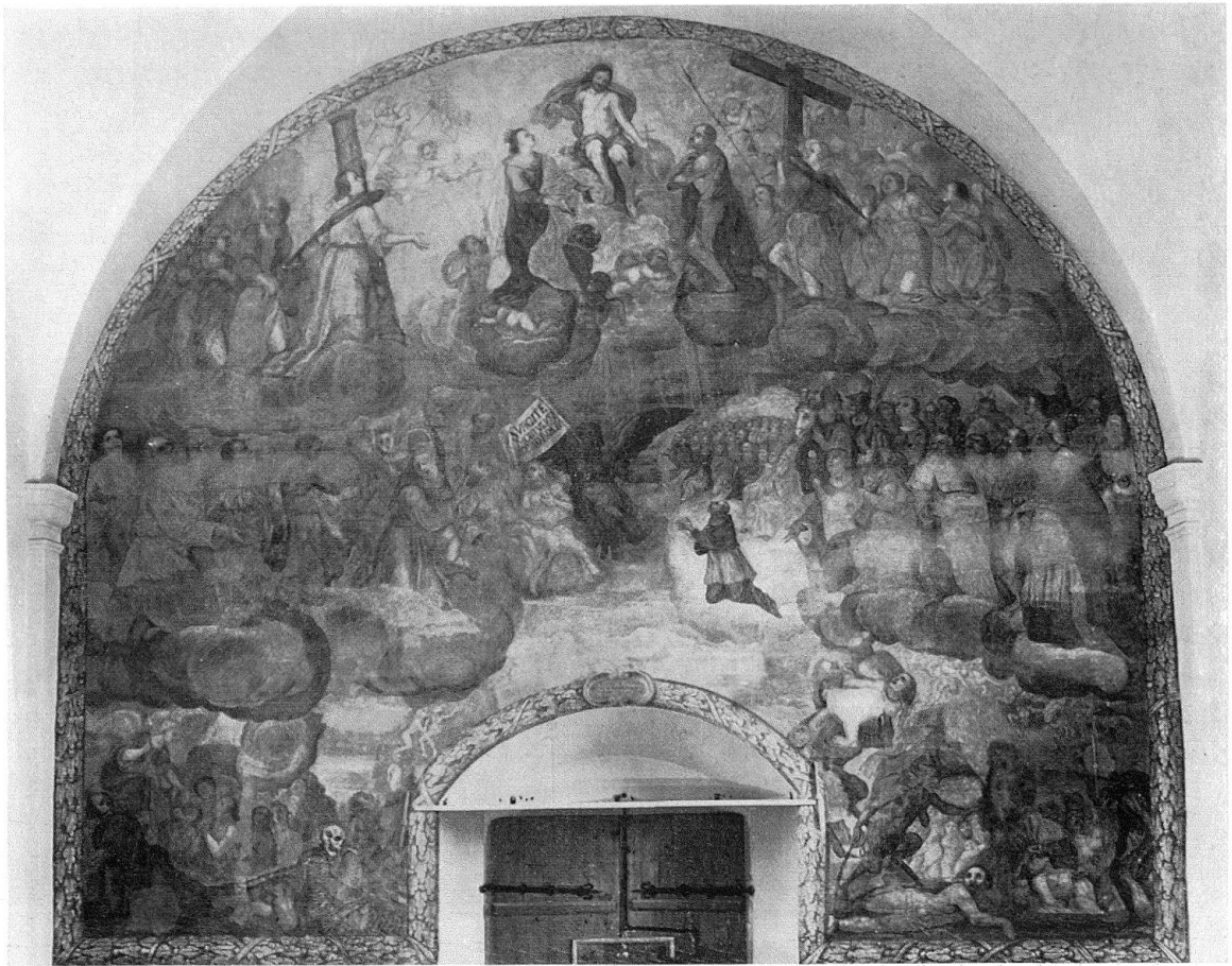
Lumbrin. Pfarrkirche St. Martin. Jüngstes Gericht

von großartiger Ausdruckskraft. Die Farbgebung beschränkt sich mit wenig Ausnahmen auf die bereits von Johann Rudolph Sturn gewählte Palette, der Bildrahmen in Form eines in grisaille gemalten Kranzgewindes bildet einen vorzüglichen Übergang. Über dem Scheitel der Türöffnung trägt eine hübsch gemalte Kartusche die berechtigt stolze Signatur des Misoxer Meisters: – EGO NIC. DE JULIANIS PICTOR MISAUCINAE ROVOREDO PINXI ANO 1694.