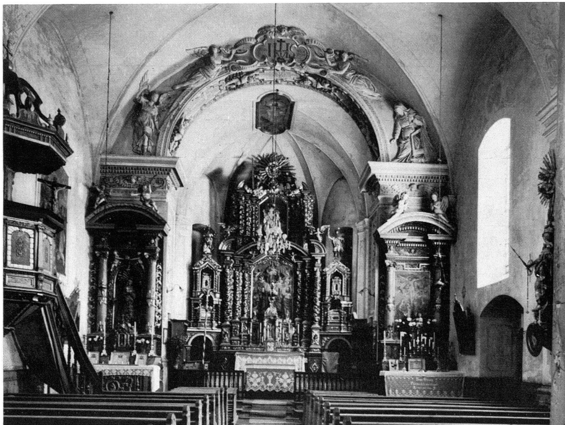
Lumbrein. Pfarrkirche St. Martin, Haupt- und Nebentäle