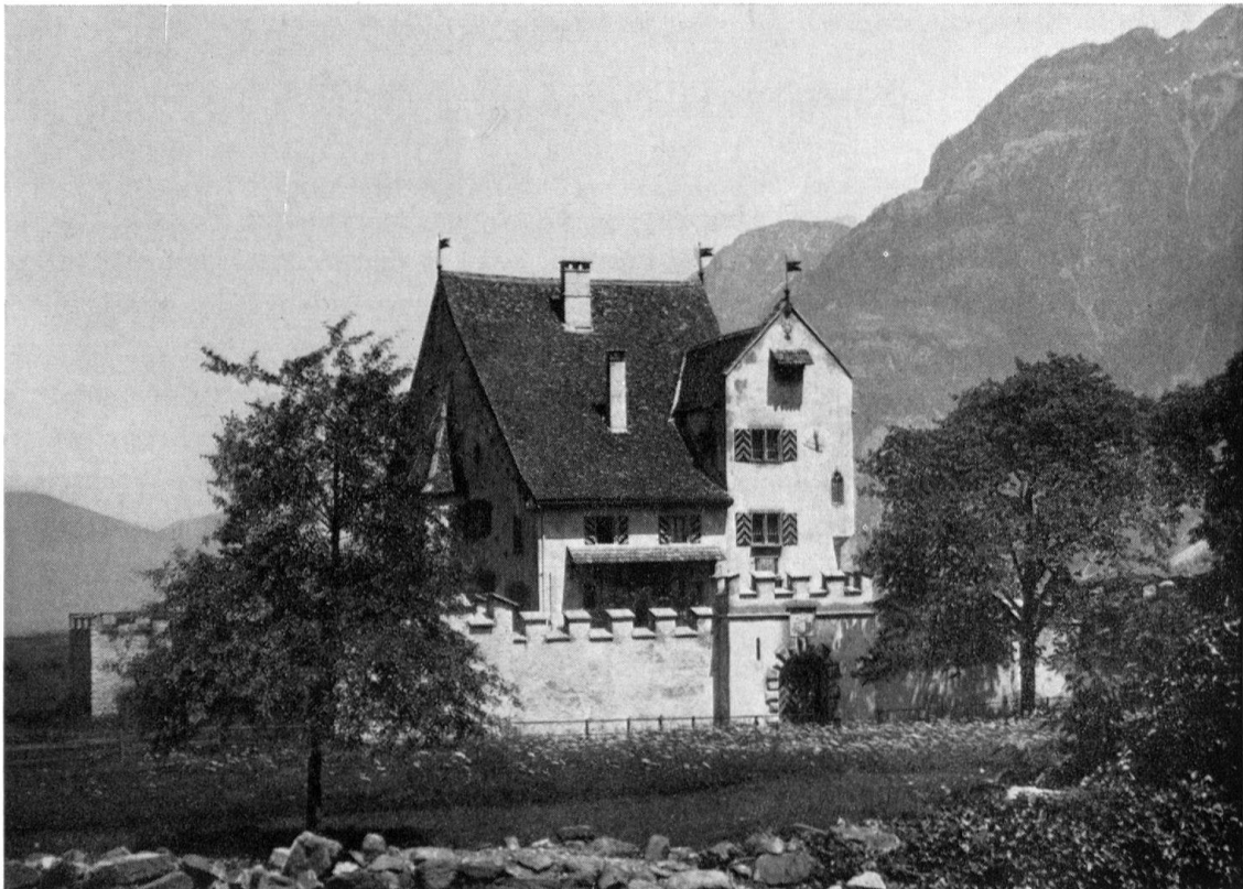
Schloß A Pro in Seedorf (Uri). Ansicht von Süden