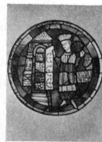
La Rose, Cathé- drale Lausanne