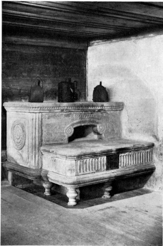
Original-Sandsteinofen, 1825, in der nördlichen Stube