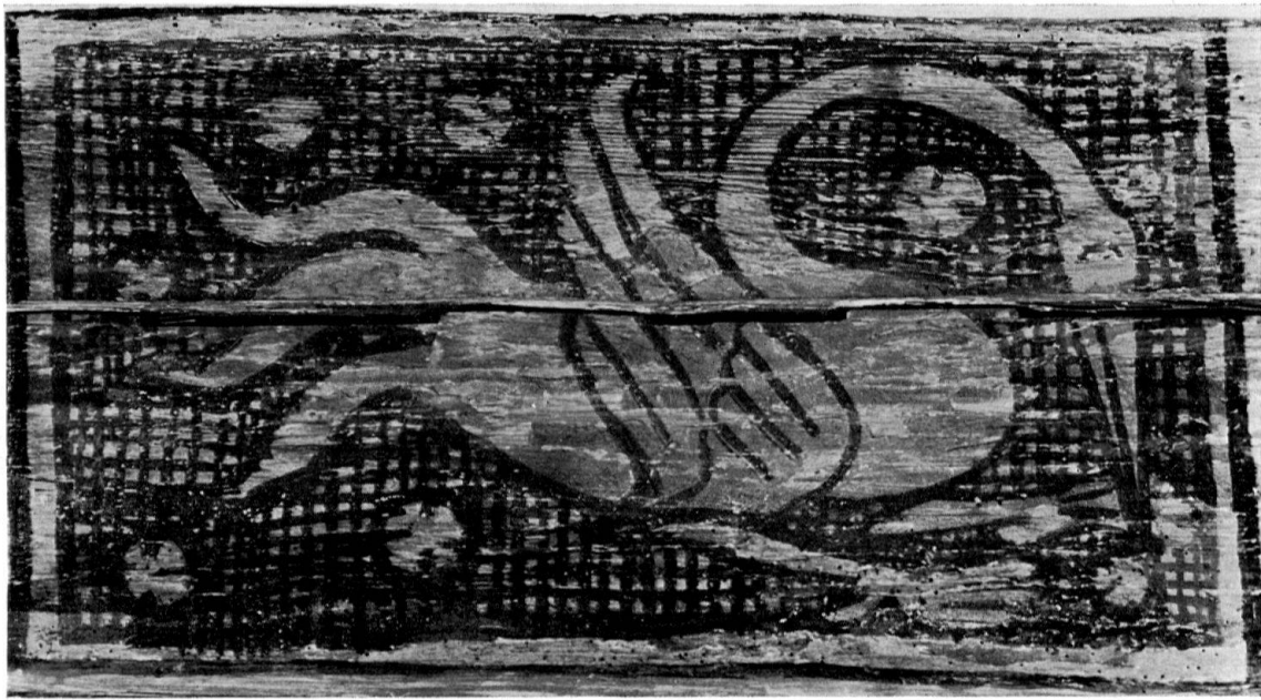
Basel, Nadelberg Nr. 6, «Schönes Haus».

Detail (Schwan) aus der bemalten Balkendecke der Erdgeschoßhalle, 2. Hälfte 13. Jh.