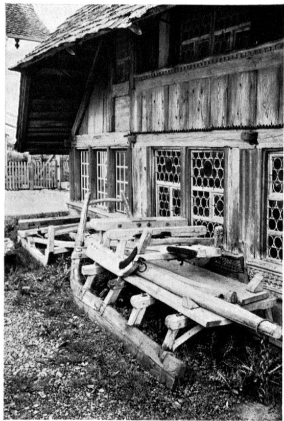
Holzschlitten vor der nördlichen Stubenfront