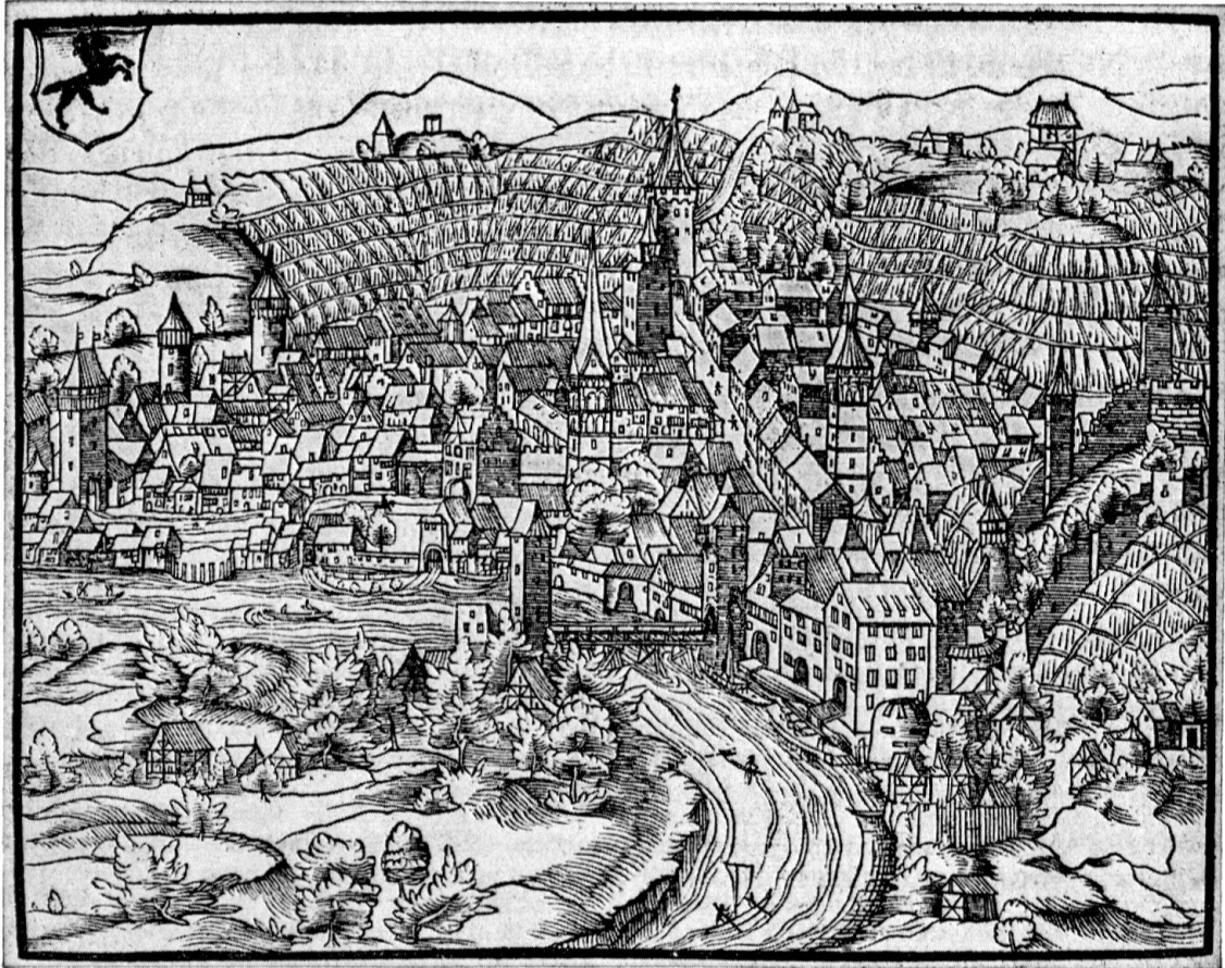
Schaffhausen. Holzschnitt in der Schweizerchronik von Johannes Stumpf, 1548