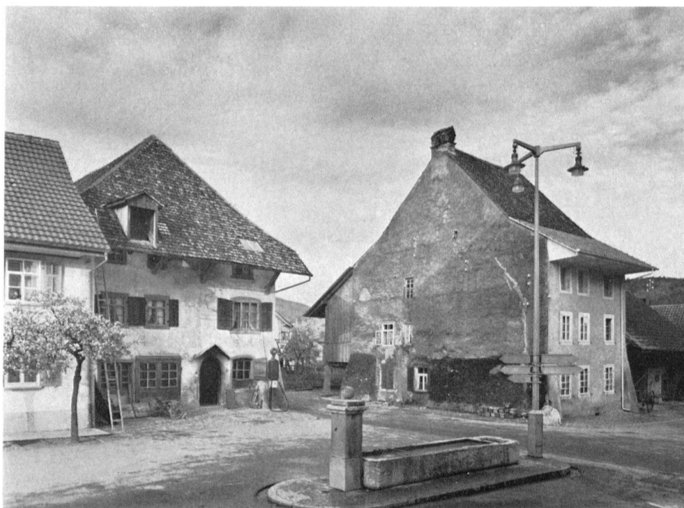
Niedererlinsbach, SO. Altes Dorfzentrum mit charakteristischen spätgotischen Bauten

len. Dem Verkehr fallen durch reihenweise Abbrüche ganze Straßenbilder und Dorfzentren zum Opfer – meist vergeblich, denn die Ortschaften müssen nach einigen Jahren doch umfahren werden (Augst, Trimbach, Glis usw.).