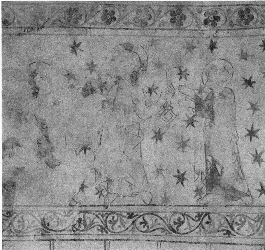
Kirche Aeschi. Nordwand: Schlüsselübergabe – rechts Petrus, in der Mitte Christus, links Johannes

Einzelne Apostelköpfe, besonders derjenige des Jakobus, sowie die Blütenranken erinnern stark an die Manesse-Liederhandschrift 4 aus dem 1. Drittel des 14. Jhs., doch fehlt den Figuren hier die höfische Eleganz. Ikonographisch und stilistisch stehen sie auch Wand- und Glasmalereien des oberrheinischen Kunstkreises dieser Zeit nahe, so zum Beispiel in Kappel (ZH) den Aposteln des Kreuzigungsbildes in der Geßlerkapelle 5 und den Chorfenstern der Klosterkirche 6 . Der Maler von Aeschi kennt jedoch keine so reiche Gewanddrapierung. Doch trotz der viel einfacheren Zeichnung scheint er in der Gestaltung der Köpfe bereits eine gewisse Individualisierung und einen Ausdruck anzustreben, der sich von den formelhaften, lieblichen Gesichtszügen in den genannten Werken unterscheidet, jedoch weit entfernt liegt von der Verinnerlichung, die im Kreuzigungsbild von 1348 in der obern Sakristei des Münsters von Konstanz 7 bereits erreicht wird. Dieser letzte Vergleich zeigt zwar eine große Ähnlichkeit im Faltenwurf, doch sind die Figuren in Aeschi noch nicht so plastisch modelliert. – In den Chorfenstern der Kirche