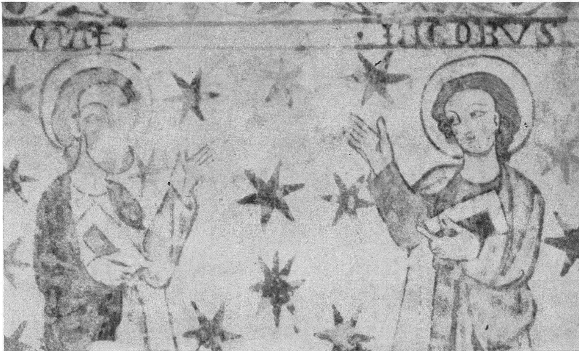
Kirche Aeschi. Südwand: Matthäus und Jakobus

im Dreiviertelprofil gegeben. Sie sind charakterisiert durch eine breite Stirn, mandelförmige Augen und zierlich geschwungene Lippen. Volles Haupthaar rahmt, in Locken bis tief in den Nacken fallend, die Gesichter ein, die bei aller Ähnlichkeit doch eine gewisse individuelle Gestaltung verraten.