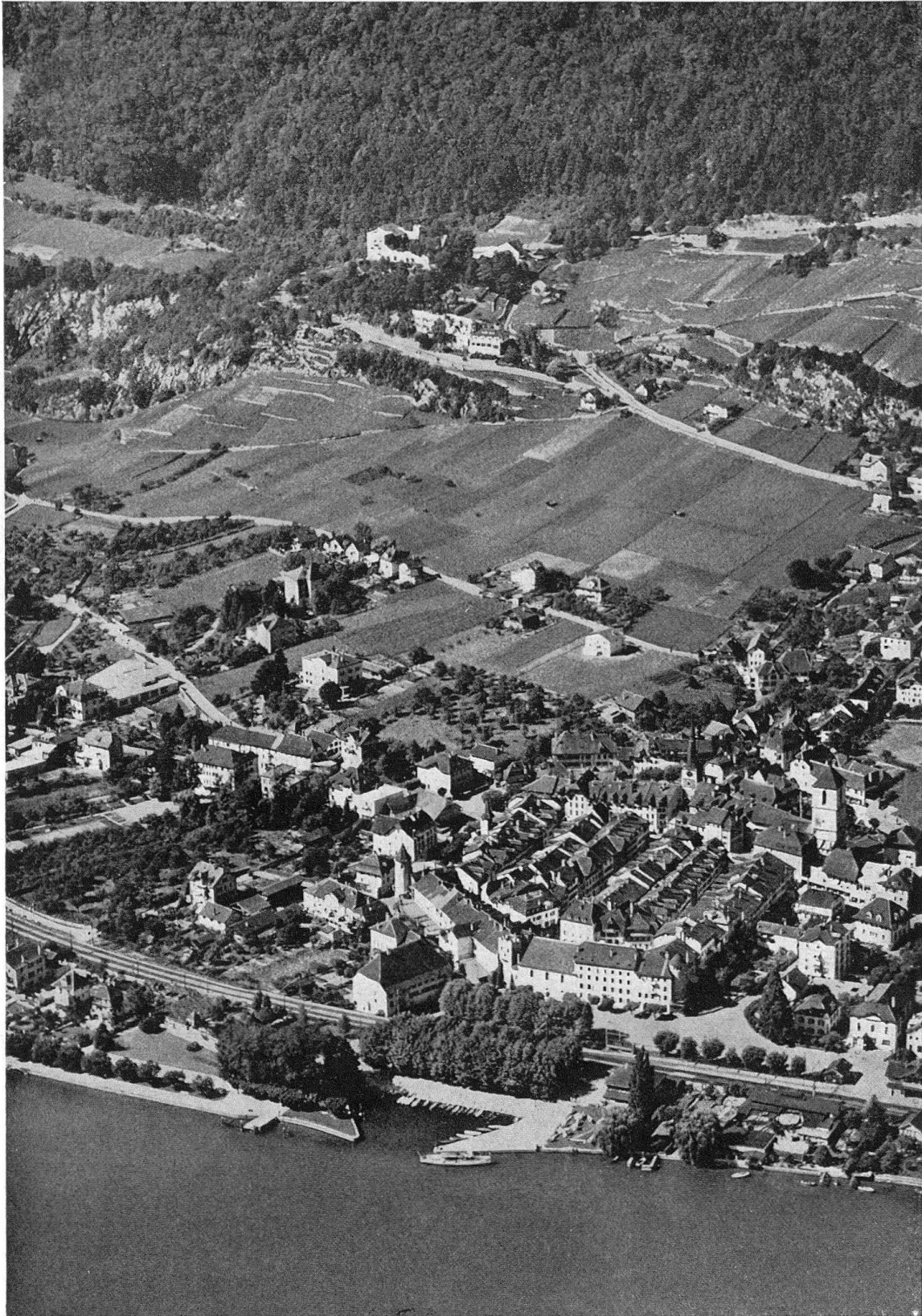
La Neuveville: die geschlossene Kleinstadt, die mittelalterliche Burg auf dem Schloßberg und Einzelbauten in spannungsvollem Gleichklang mit See, Rebgelände und Waldabhang