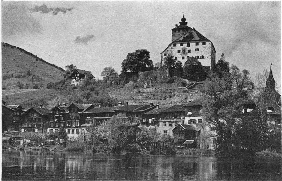
Werdenberg: Kleinteilig kuschelt sich das Städtchen an den See, mächtig krönt das Schloß den Burghügel

menschliche Schicksalsgemeinschaften errichteten Bauanlagen dar. Gemeint sind wiederum zur Hauptsache schlichte, jedoch fein aufeinander bezogene Gebäulichkeiten in Weilern, unter sich eng verbundene, lebendig gegliederte Häuserreihen an Straßenzügen und um Platzgefüge in Dörfern, Marktflecken und Städten mit ihren wahrzeichenhaften Kapellen, Kirchen und Klöstern, aber auch die packenden Formationen einzelner Partien oder ganzer Komplexe von Siedelungen. Sie strahlen behagliche Geborgenheit – ja Be-seeltheit sogar noch stärker aus als die ungewöhnlich glanzvollen Einzelobjekte und be-stimmen weit nachhaltiger als jene den eigentümlichen Charakter, das Lokalkolorit unserer Regionen. In ihren aus vielfältigen, aber ähnlichen, ja verwandten Elementen geformten Einheiten ist der Mensch das Maß der Dinge; für ihn müssen diese in verschiedenen Stilepochen gewachsenen und durch manche Einflüsse mitbefruchteten baulichen Ordnungsgebilde – Schatzkammern unserer Kultur – weiterbestehen; sie prägen seine Wesensart, stützen sein Bewußtsein, regen zur Besinnung an und geben Gästen einen Spiegel seiner selbst.