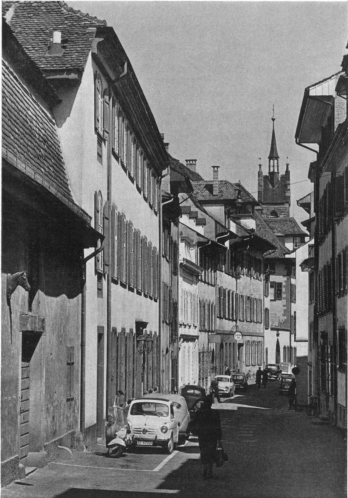
Basel, Nadelberg gegen Peterskirche : ein schlichtes, einmaliges und unverwechselbares, ein bewegendes Gassenbild