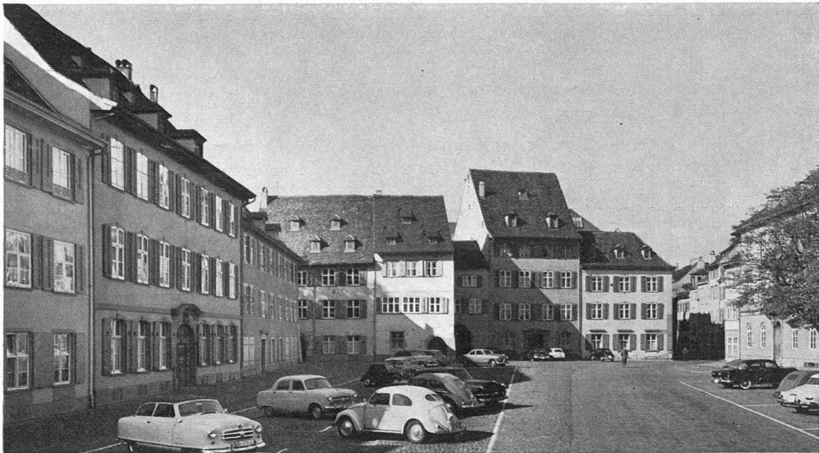
Basel. Münsterplatz gegen Nordwesten: barocke Fassaden auf mittelalterlichen Grundrissen, einen großzügigen Raum charaktervoll begrenzend

Beim Erfüllen unserer schweren Pflicht verfolgen wir Denkmal- und Heimatpfleger keine engen fachlichen Selbstzwecke. Wir versuchen vielmehr, den gehetzten und zermürbten Erdenkindern des 20. Jhs. und ihren wahrscheinlich noch bedrängteren Nachfahren die ererbten wundervollen ideellen Allgemeingüter der Natur und Kultur zur Ermunterung und Erhebung zu bewahren. Denn diese herrlichen Werte mit ihren humanen Ruf- und Sendekräften bilden in einer immer stärker auf das Materielle ausgerichteten Welt zunehmender Technisierung, Mechanisierung und Automatisierung notwendige Gegenpole für das Gemüt, reine Quellen der Freude, ja wahrhafte Träger geistiger Botschaften.