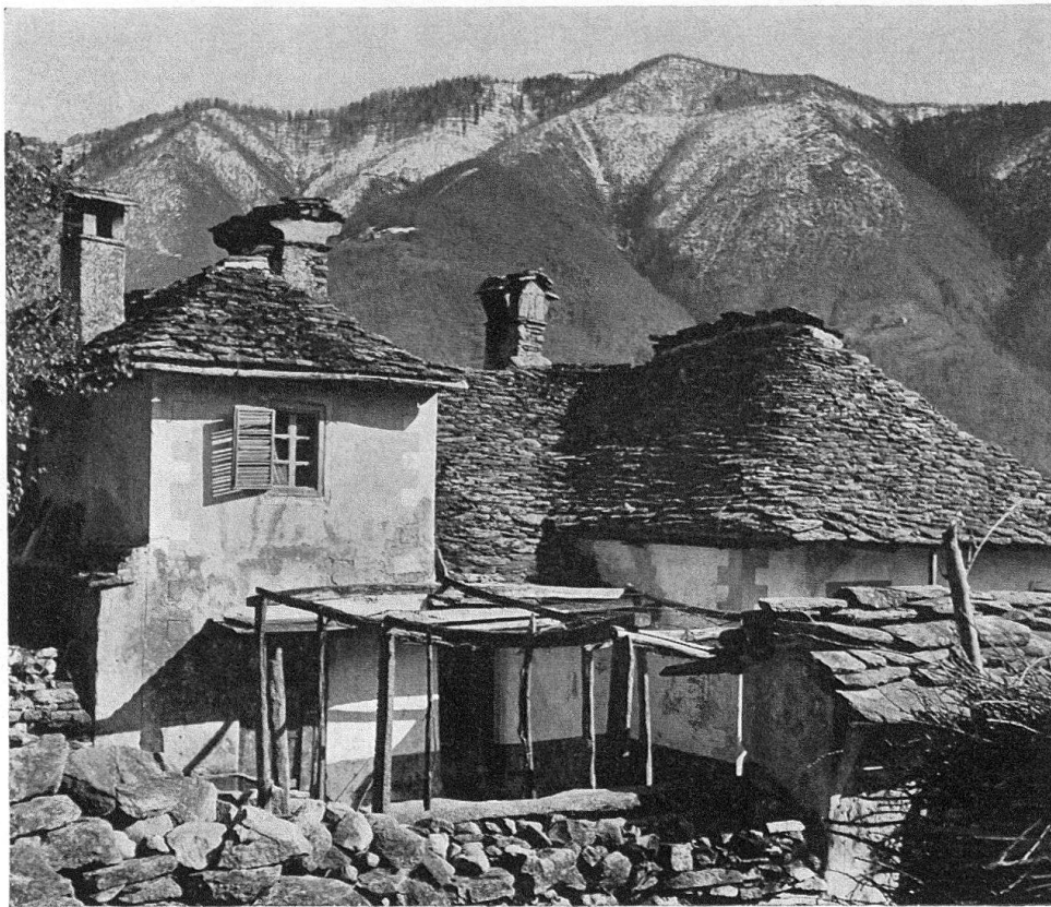
Häusergruppe zu Mosogno im Onsernonetal: Vollendete Übereinstimmung von Architektur und Natur

Naturschönheiten, Kulturlandschaften und Stätten wichtiger Geschichtsereignisse leiden indessen heute ebenso wie die Kunstdenkmäler unter der wildwogenden Bauflut, welche sich von den wichtigen Stadtzentren über das Umland ergießt; deren Wellen drohen natürliche Gebiete mit ihren Weilern und Dörfern zu überschwemmen, welche in ihrem Weiterbestand schon durch die unausweichliche Umstellung der bäuerlichen Arbeit auf Maschineneinsatz wie ihre einseitige Hinwendung zu besonderen Teilen ihrer