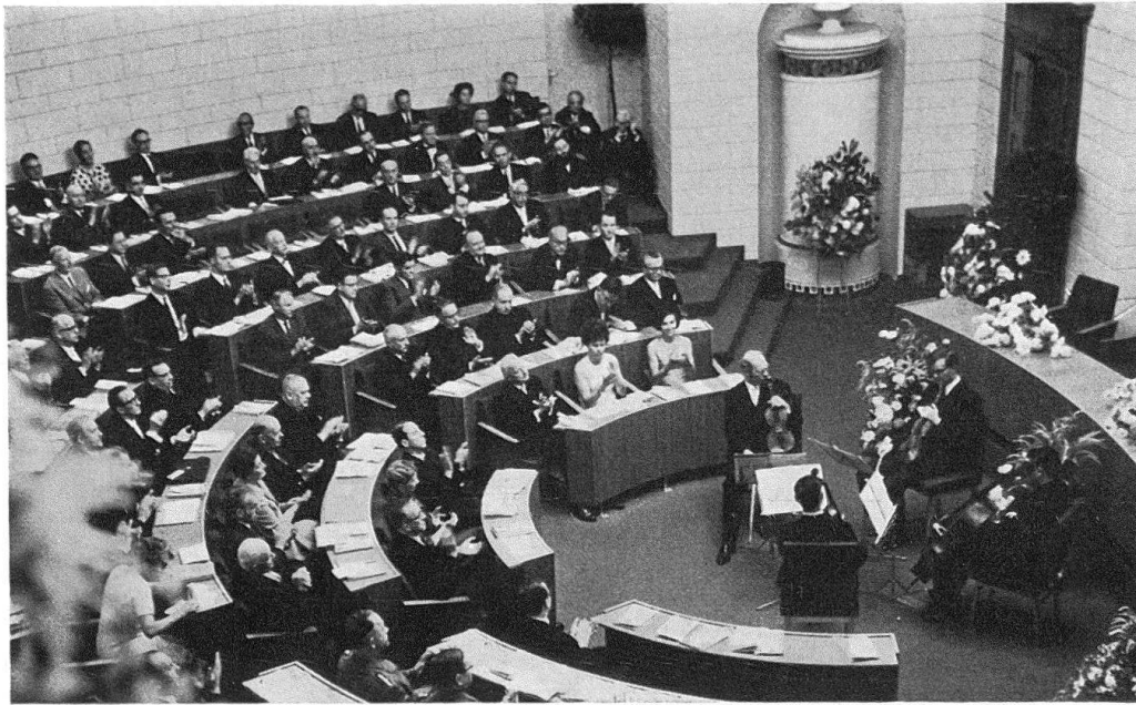
Die Festversammlung im Großratssaal in Luzern; sie hörte die Ansprachen von Prof. Dr. A. A. Schmid und Bundesrat H. P. Tschudi

Zeit sein Maximum. Dabei ist zu bedenken, daß die Bundesbeiträge in den ersten Jahrzehnten in der Regel 50% der subventionierbaren Kosten betrug. Erst im Reglement von 1914 wurden sie, je nach der Bedeutung des zu restaurierenden Bauwerks, auf maximal 30, 40 und 50% begrenzt. 1912 beschloß der Bundesrat angesichts der zunehmenden Verschuldung der Gesellschaft durch feste Subventionszusicherungen, die indirekt auch den Bund engagierten, bis auf weiteres alle neuen Gesuche zurückzustellen. Seit 1914 wurden aus dem gleichen Grunde bei Kostenüberschreitungen einstweilen auch keine Nachsubventionen mehr bewilligt.