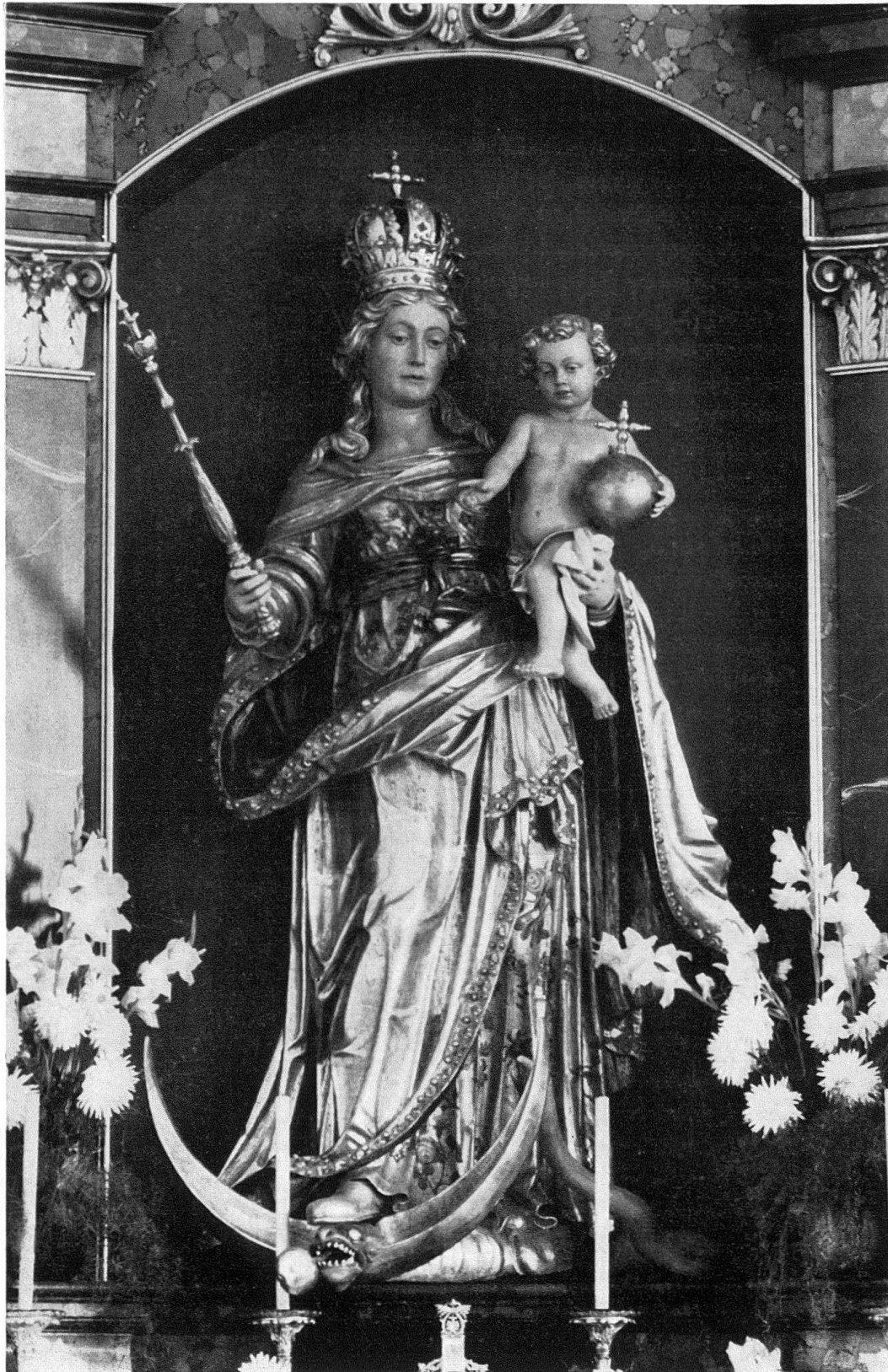
Mörschwil, Pfarrkirche Madonna