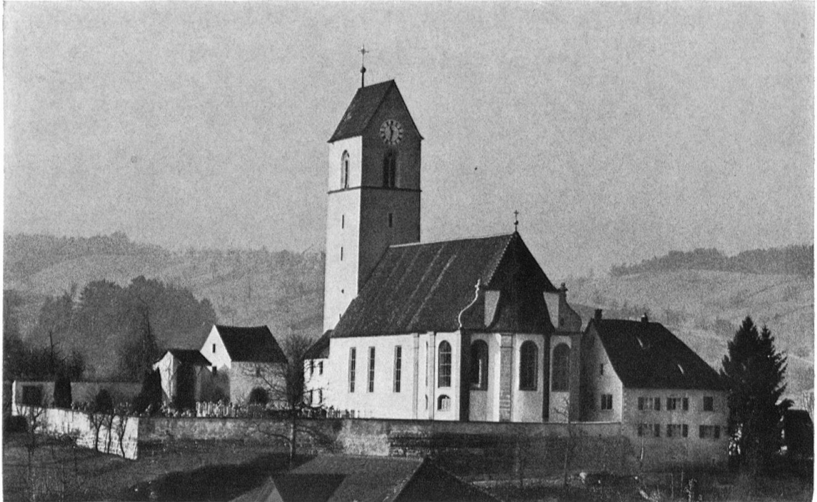
Die katholische Pfarrkirche von Herznach , Kanton Aargau. Außenansicht

Herausgegeben von der Gesellschaft für Schweizerische Kunstgeschichte