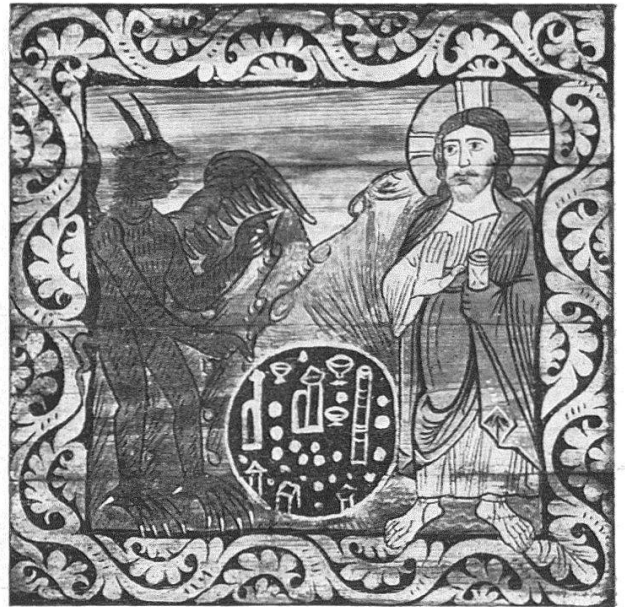
Links: Die Darstellung im Tempel. Deckengemälde in Zillis. Rechts: Die dritte Versuchung Christi. Deckengemälde in Zillis. Im Hintergrund erscheint eine Gebirgslandschaft mit abgeflachter Kuppe, pyramidenförmiger Bergspitze und Schluchten