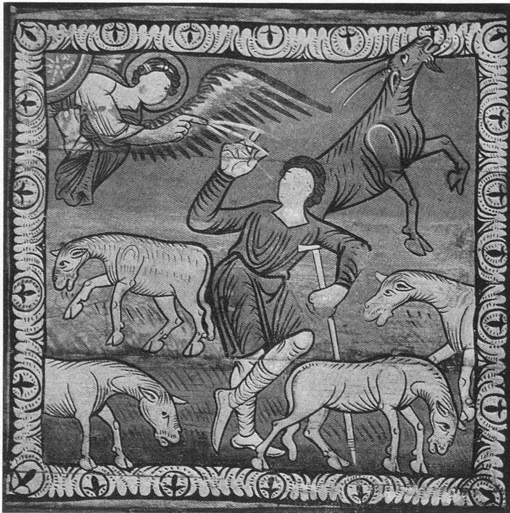
Verkündigung an die Hirten. Deckengemälde in Zillis

der Ansicht von Rahn und Durrer in Engelberg selbst angefertigt wurde 27 , erscheint eine Bergkuppe, die P. E. Omlin als Titlis identifizierte 28 . Eine weitere Gebirgslandschaft der Zeit um 1200 findet sich groß hingemalt am Triumphbogen der St. Jakobskirche in Grissian (Südtirol). Edmund Theil 29 erkennt in ihr «die Mendel, die Kette des Rosengartens, den Schlern und die Santnerspitze» und bemerkt dazu: «Dieses Fresko dürfte das älteste, uns bis heute bekannte Gemälde aus der Zeit um 1200 sein, auf dem ein Künstler bewußt mit der Tradition bricht und die Natur wiederzugeben sucht.» Dabei ist zu sagen, daß die Landschaft der Zilliser Decke entschieden viel naturwahrer wirkt, als jene im Fresko von Grissian.