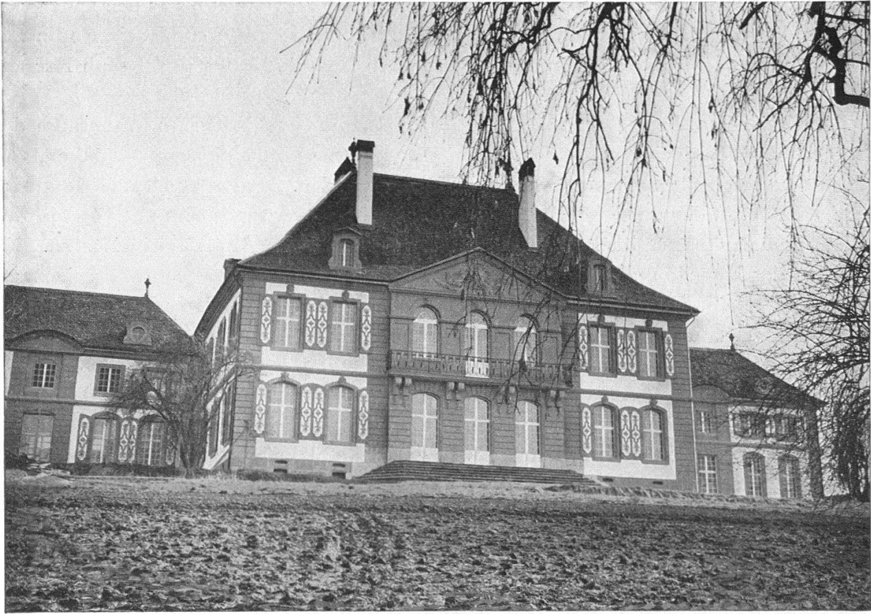
Schloß Hindelbank von Norden, nach Restaurierung des Äußern 1964

Hofportals waren, wiederverwendet auf dem Thorberg, noch vorhanden. Mit Ausnahme der Hoffassade des Hauptgebäudes, die noch vor wenigen Jahren überholt worden war, mußten sämtliche Fassaden restauriert werden. Die Gitterstäbe in den Fenstern verschwanden, die alte Fensterteilung wurde wieder hergestellt und auf Grund von am Schlosse selbst erhaltenen Beispielen erhielt der gesamte Baukomplex wieder rotweiße Fensterläden mit Régenceornamenten (Abb. oben).