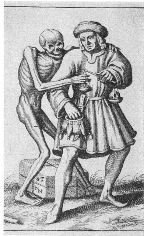
1 Bartholomäus-Tafel des Heilspiegelaltares von Konrad Witz, um 1435 und um 1440. – 2 Ausschnitte von Abb. rechts (Paketzeichen) und von Abb. links (Steinmetzzeichen, spiegelverkehrt). – 3 Tod und Kaufmann, Kupferstich von M. Merian (1621) nach dem 19. Paar des Basler Predigertotentanzes

scher und Holbeinischer Herkunft – vor allem das hektische Hopsen, das manierierte Tänzeln am Ort und die zusätzlichen Attribute – den vornehmlich in einer einzigen Ebene sich abwickelnden Bewegungsfluß noch nicht zerstückelt hatten. Von den authentischen Paaren erreichten einzig «Tod und Jungfrau» die Dichte der Kaufmannsgruppe. – Eine übergreifende Bedeutung mag auch für die Aussage der Mittelgruppe nachzuweisen, mag etwa von den lapidaren Zeilen «der nympt weder gelt noch gut» und «... hat mich umb lib und (leben) brocht» ausgegangen sein.