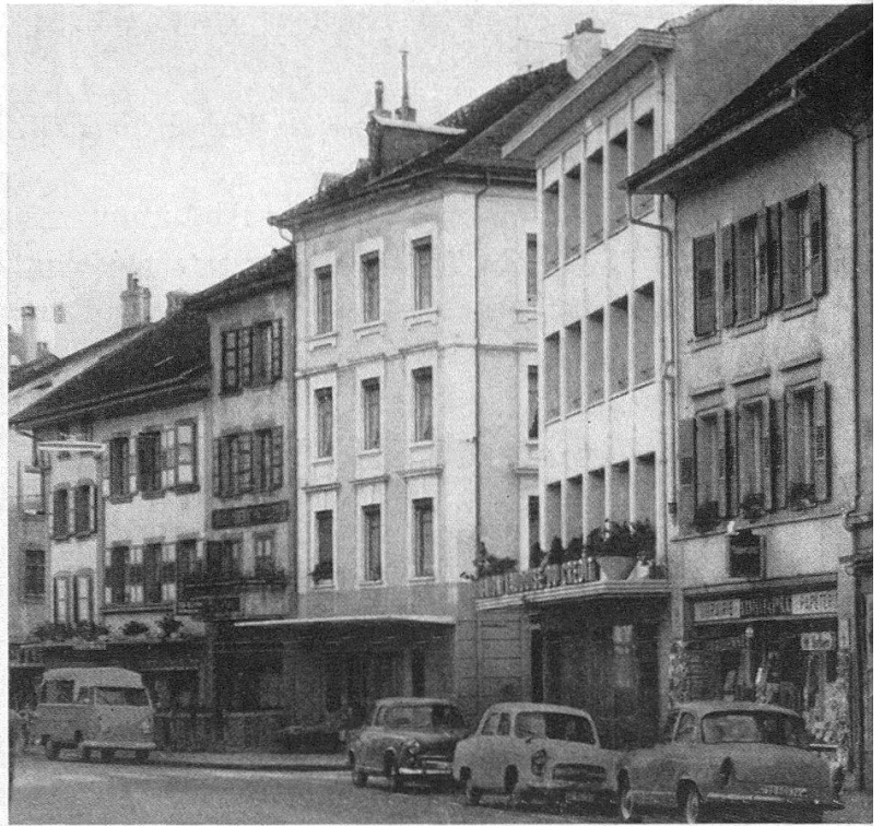
Payerne, Rue de Lausanne, Blick gegen Süden.

Links: alter Zustand. Rechts: Neubau Union Vaudoise du Crédit, Einmündung Ruelle des deux-tours.