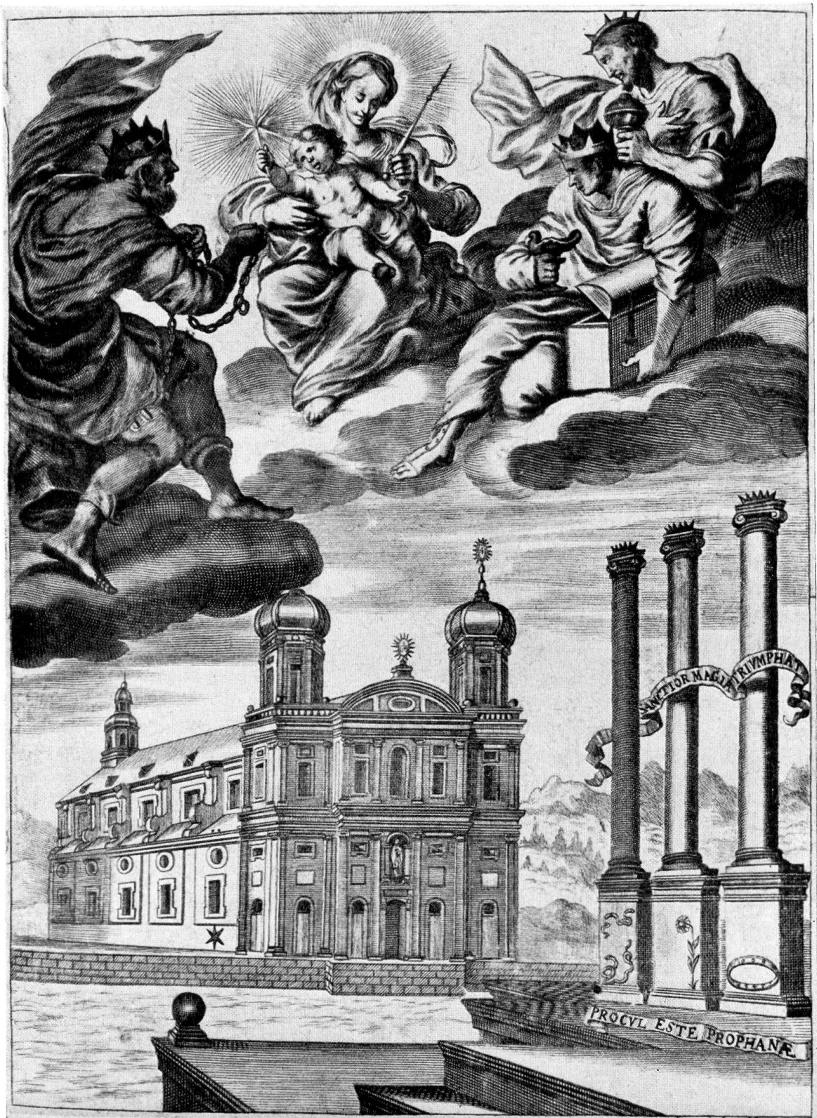
Luzern, Jesuitenkirche. Projektstich von 1666, Zentralbibliothek Luzern