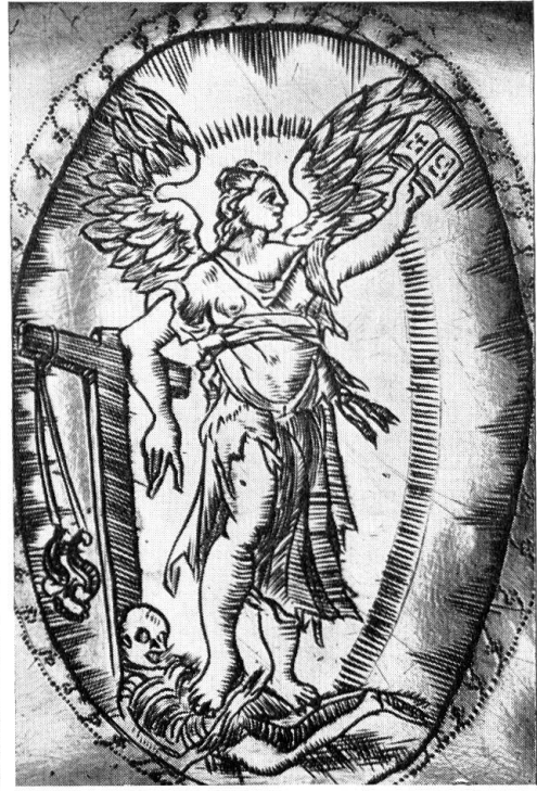
Plat de communion de la paroisse de Coppet-Commugny. Détail

«... Le fameux Nahl nous a envoyé deux dessins pour remplir le tympan du fronton. L'un représente la Religion sous l'emblème ordinaire d'une femme assise avec les attribus et environnée de genies qui sortent des nuages. L'autre représente au milieu le nouveau Testament sous l'emblème d'une croix couchée sur le milieu de laquelle est le livre Saint ouvert avec divers autres attribus très expressifs, à la droite on voit l'arche de l'alliance avec les attribut du sacerdoce judaïque, à la gauche les Tables de la Loy de Moïse sur un rocher, et par dessous, le serpent d'airain attaché à une perche couchée et au dessus de toutes ces figures dans le haut du fronton, est représenté l'œil de la Providence qui préside sur le tout. Ce dernier m'a paru d'un grand goût, très bien adapté à l'Edifice, et très propre à orner, il (Nahl) a évité d'y mettre aucune figure; Mr Lambelet le préfère de beaucoup, et par contre l'autre a aussi des partisans parmi des personnes de bon goût. Nous les luy (à Nahl) avons renvoyé l'un et l'autre avec la liberté de décider celui qu'il trouvera à propos de se charger de l'exécuter en cire pour servir de modèle à l'ouvrier...»