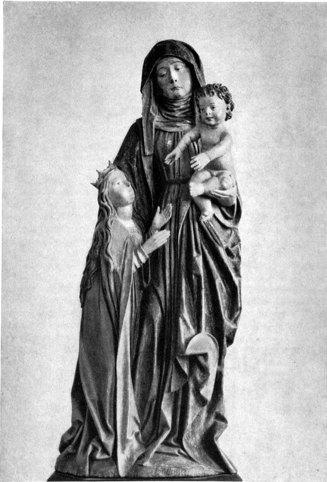
Hl. Anna selbdritt. Spätgotische Gruppe aus der Zeit um 1500 in der Römisch-katholischen Kirche von Rheinfelden