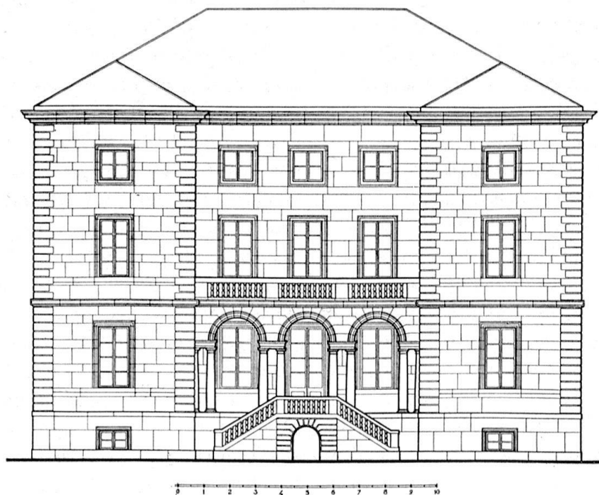
Façade sud de la Maison Louis-Auguste de Pourtalès à Neuchâtel