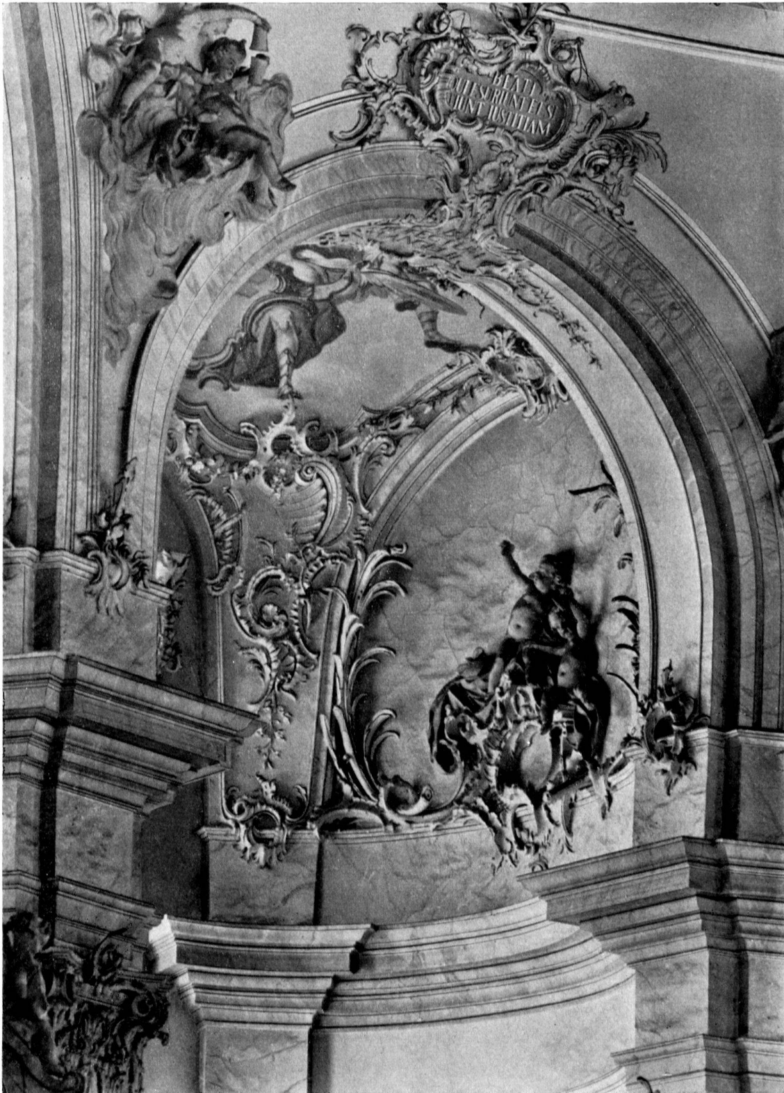
St. Gallen, Stiftskirche. Blick in das Gewölbe des Rotundenumganges