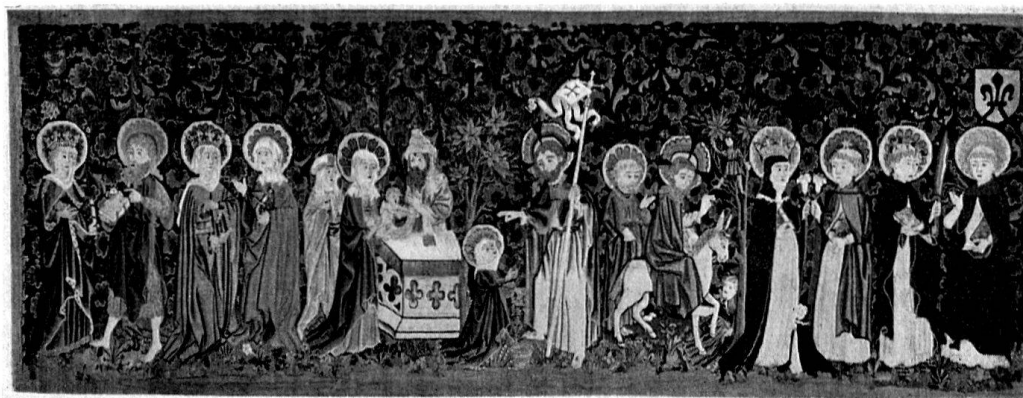
Basel, Schönkindteppich aus dem Kloster Klingental. Um 1480. Historisches Museum