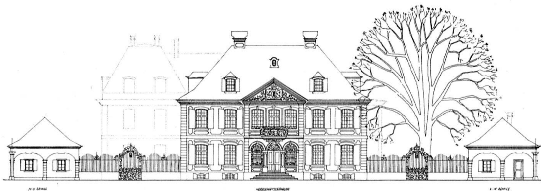
Straßenfront der «Sandgrube» in Basel. Heutiger Zustand nach der Zeichnung von Arch. Fritz Lauber. Links der entfernte Anbau aus der Mitte des 19. Jhs.