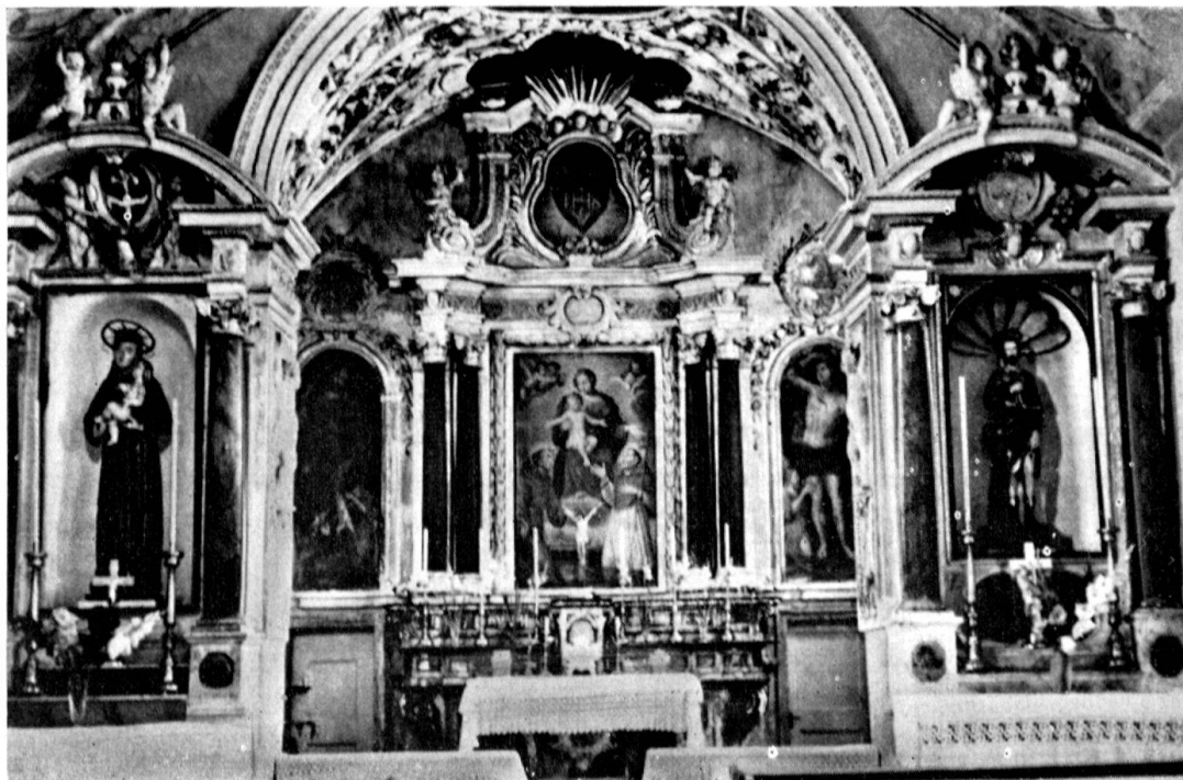
Cappella di San Rocco e San Sebastiano in Grono

I lettori del nostro «Bollettino» hanno potuto seguire, attraverso l'autorevole parola di Erwin Poeschel, le fasi più importanti della lotta per la salvezza di questo edificio e della Piazzetta caratteristica che l'edificio stesso determina. (Cfr. No. 2 e No. 3, 1958.) Dopo che il Gran Consiglio del Cantone Grigioni ebbe deciso definitivamente la circonvallazione del villaggio, un attivo Comitato, diretto dal dinamico parroco di Grono Don