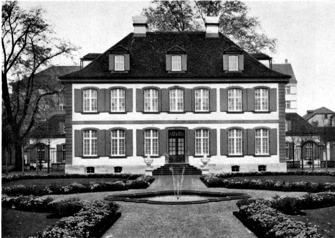
Gartenfassade der «Sandgrube» nach der Wiederherstellung

Fr. 4 500 000.—. Als eingreifende bauliche Veränderung ist vor allem die Verlängerung des Herrschaftshauses um die Mitte des 19. Jhs. zu erwähnen. Im großen und ganzen blieb die Gesamtanlage während fast zweihundert Jahren die ursprüngliche: gegen die Straße hin öffnet sich hinter einem prachtvollen Gitter ein breitrechteckiger Hof, flankiert von pavillonartigen einstöckigen Dienstbauten und Remisen. Das zweistöckige, in der Hauptachse liegende Herrschaftshaus, mit seinen seitlichen Gartengittern, schließt den Platz gegen Süden ab.