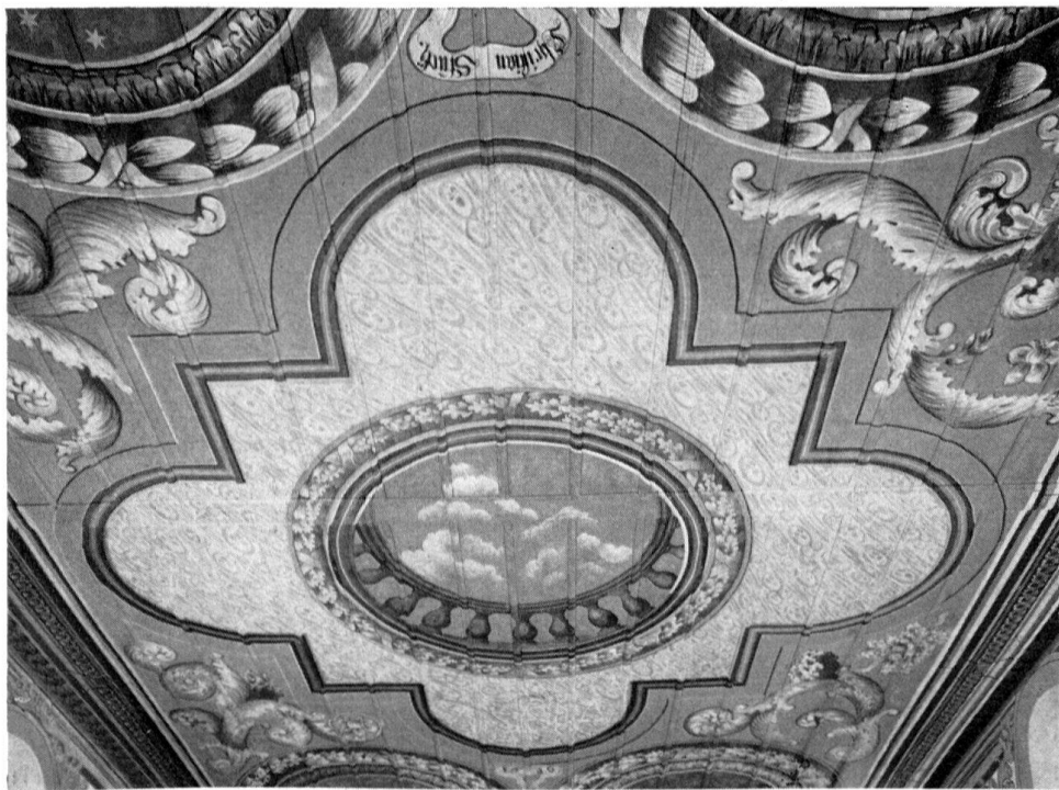
Trachselwald, Decke der Kirche. Gemalt von Christian Stucki 1686

So entstand im Jahre 1686 ein Gotteshaus, das für die Auffassung bernischen ländlichen Barocks beispielhaft ist. Der Kirchenraum erhält Licht durch Rundbogenfenster. Die flache Holzdecke ist bunt bemalt. 5 Medaillons vermitteln die Illusion eines Durchblickes in den Himmel, was im altbernischen Gebiet einzig dasteht (Abbildung). Kränze, üppig gerolltes Blattwerk mit Blumen, vorwiegend in den Tönen grau, ocker, blau, schwarz und weiß gehalten, beleben, über die Struktur der Decke weggemalt, den Raum. Die Fenster sind mit derbem, etwas schwerfälligem Rankenwerk eingefasst, das uns die Epoche des Knorpelstils spüren läßt.