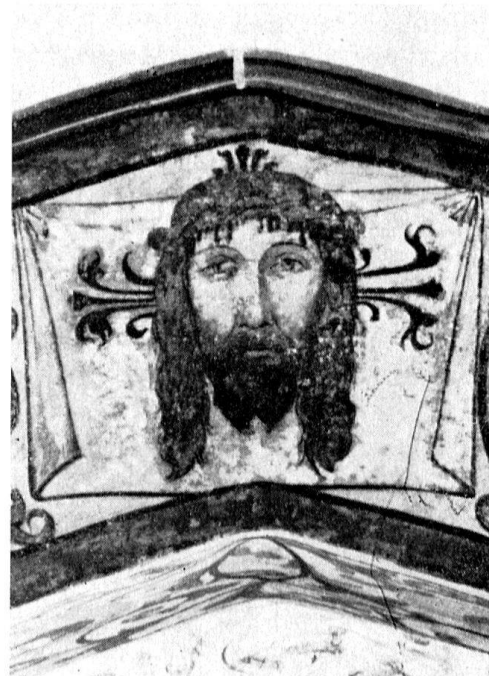
Schweiß Tuch der hl. Veronika. Links: Spolvero im Staatsarchiv Zürich Rechts: Wandgemälde im Chorbogen der Kirche von Rüti