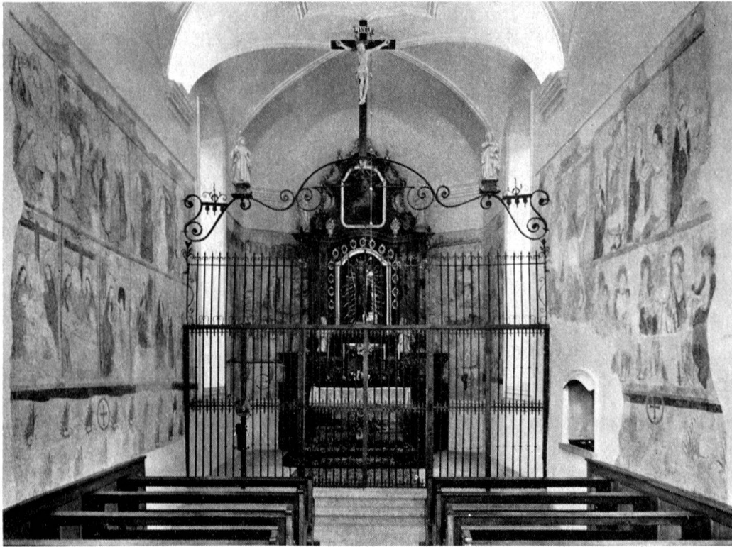
Bremgarten, Muttergotteskapelle. Inneres nach der Wiederherstellung

Der von mindestens vier verschiedenen Meistern geschaffene Zyklus zeigt an der nördlichen Chorwand Szenen aus der Annen- und Marienlegende, unter anderem die seltene Darstellung der teppichwirkenden Maria, die den Tempeldienst versieht; an der gegenüberliegenden Chorwand eine vielfigurige hl. Sippe, die Geburt Christi und die Anbetung der hl. Drei Könige, eine Schutzmantelmadonna und der bethlehemitische Kindermord; an der nördlichen Schiffswand Passionsszenen und an der gegenüberliegenden Südwand verschiedene Heiligenbildnisse, unter anderem ein Ritter Georg zu Pferd.