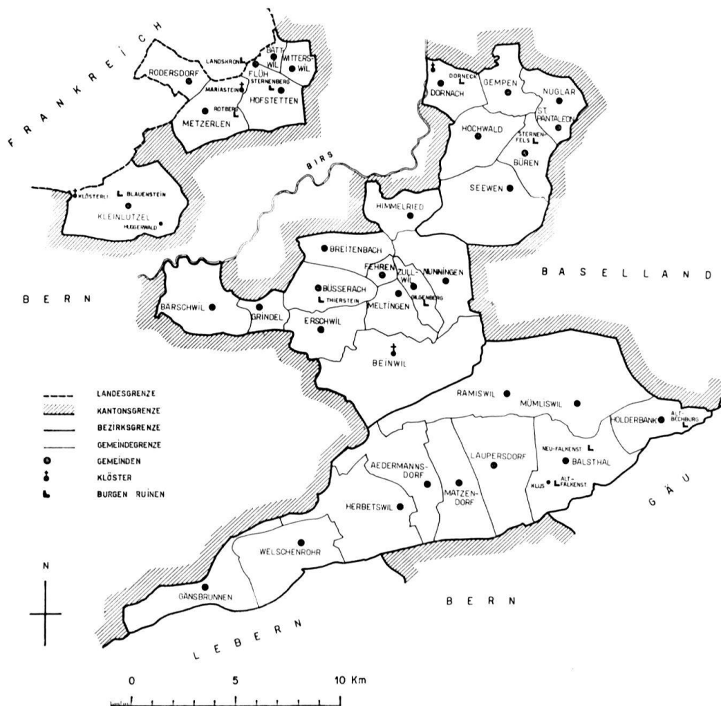
Übersichtskarte der Bezirke Thal, Thierstein und Dorneck

Dieser zuerst erscheinende der drei solothurnischen Bände umfaßt das zerrissene Gebiet des Solothurner Jura von der Weißensteinkette bis zur elsässischen Grenze und bis gegen Basel. Die ländliche Gegend wurde von den großen Kunstströmungen wenig berührt. Hier dominiert die dörfliche Kultur in schlichten Kirchen, Klöstern, Kapellen, Wegheiligtümern und Profanbauten, wobei das Bauernhaus vorherrscht. So weit es in unserer Aufgabe liegt, ist auch auf diese bäuerliche Architektur eingegangen. Mariastein mit seiner eigenartigen spätgotisch-barocken Anlage bedarf als bekannter Wallfahrtsort einer besonderen Erwähnung. Die Plastik ist mit einem reichen Bestand vertreten, einige Stücke sind von hoher Qualität. Zahlreich sind die mittelalterlichen Burgen, welche später teilweise als Landvogteisitze dienten (Neu-Falkenstein, Dorneck usw). Die Beschreibungen des Autors lassen deutlich seine denkmalpflegerische Tätigkeit erkennen. Vgl. Abb. S. 4. M