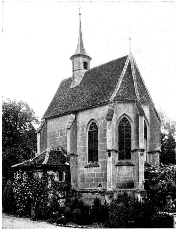
Fribourg, la chapelle du château de Pérolles (voir article p. 70)