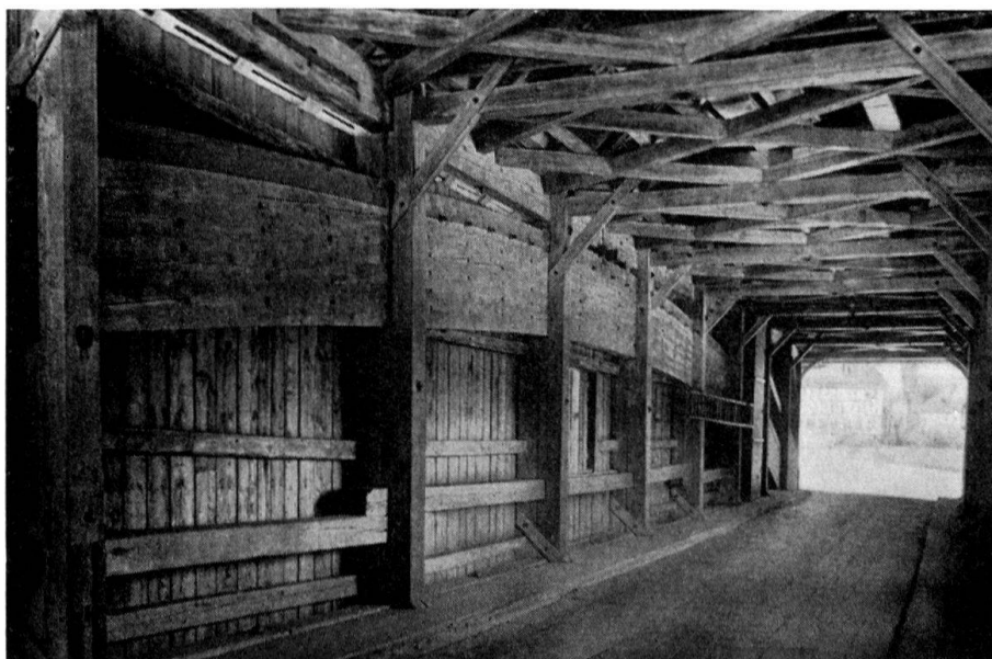
Gedeckte Sitterbrücke bei Bischofzell. (Vgl. Mitteilungsblatt Nr. 1, Seite 12)