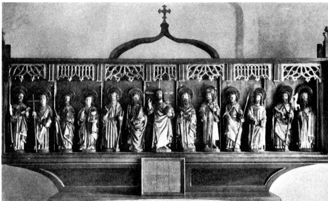
Franex, chapelle, le Christ et les apôtres