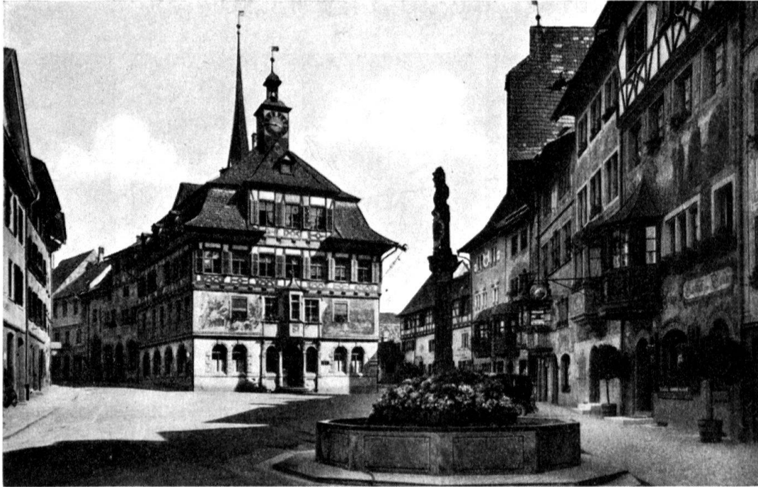
Stein a. Rhein, Rathausplatz