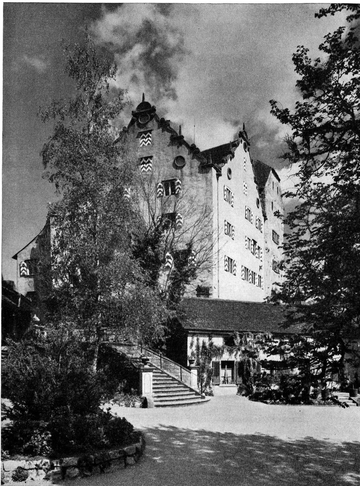
Schloß Wildegg von Süden. Kanton Aargau, Bezirk Lenzburg