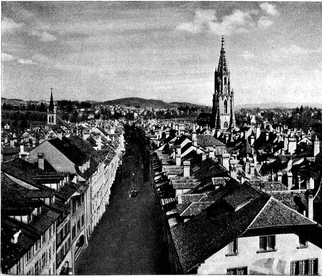
Bern. Blick vom Zeitlockenturm auf Kramgasse und Münster.